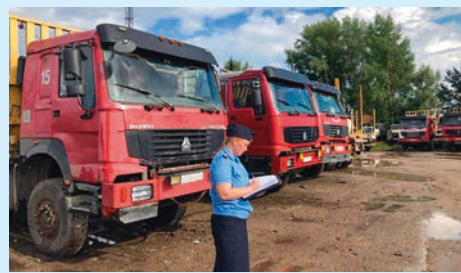
Должники из Поднебесной