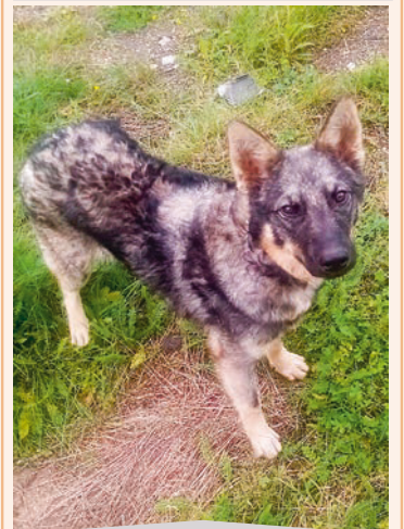
Мальчик, 7 мес. Небольшой, шерсть волнистая. Отловлен 3 сентября на ул. Курьинской. Хозяин, отзовись.