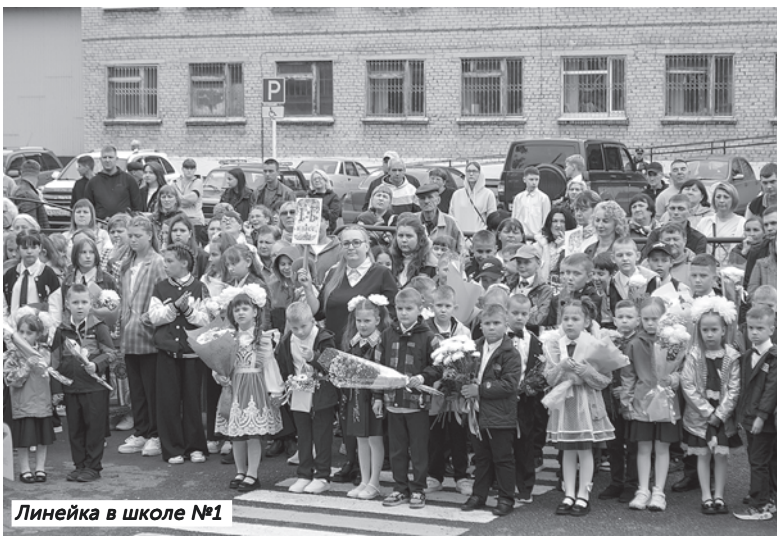
Линейка в школе №1

В каждой школе по уже сложившейся традиции звучал гимн России, а лучшие ученики приняли участие в церемонии поднятия флага нашей страны. Директора образовательных учреждений и приглашенные гости адресовали ученикам, их родителям и, конечно же, педагогам напутственные слова, открывая новый учебный год. Ребятам пожелали успехов в освоении школьных наук, а старшекласс-