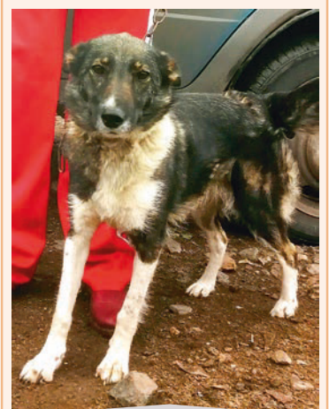
Девочка ЖУЖА. Небольшая, послушная, хороший сторож.