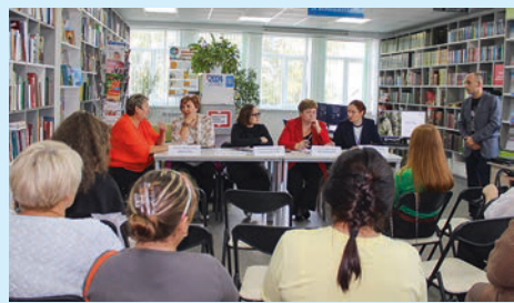
СВОих не бросают