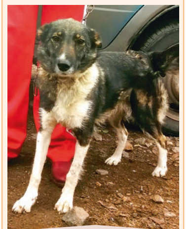
Девочка ЖУЖА . Небольшая, послушная, хороший сторож.