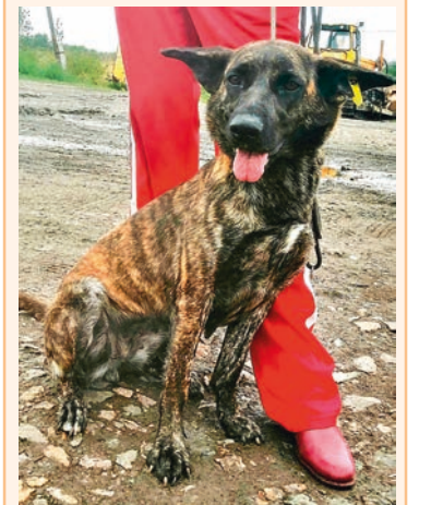
НАГАТАКА (в переводе с эскимосского языка - «Слушает»), стерилизованная, гладкошерстная, любит детей.