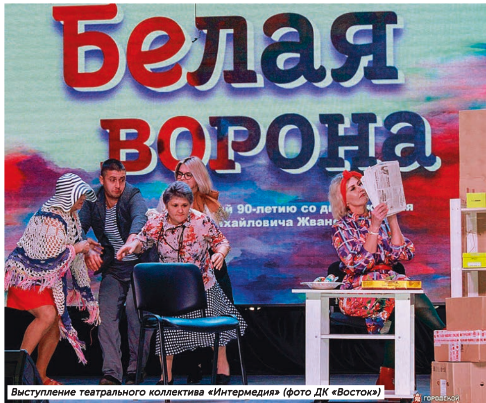
Выступление театрального коллектива «Интермедия»

На конкурсе было представлено 15 номеров в двух номинациях в разных возрастных категориях. Жюри отметило яркое и эффектное выступление участников в театральных миниатюрах, а уж зрители (особенно из групп поддержки) и подавно были в восторге. Некоторые из конкурсантов проявили себя не только как талантливые артисты, но и как авторы, представив собственные монологи в популярном жанре «Stand up».