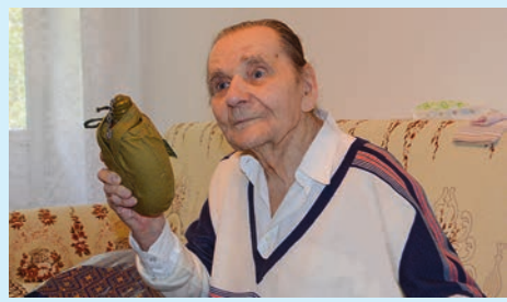
Все внимание фронтвику