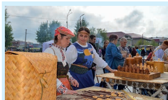
Бересты резная красота