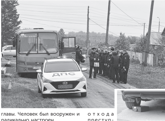
главы. Человек был вооружен и радикально настроен.

Утром 7 июня село Ягодное оживилось. Из Асина в сторону данного населенного пункта один за другим мчались спецавтомобили с проблесковыми маячками. Здание сельской администрации и прилегающие подъездные пути плотно оцепили сотрудники правоохранительных структур. На место выехали также представители администрации Асиновского района. Неподалеку от места оцепления дежурила бригада скорой медицинской помощи. Так в этот день проходила комплексная тренировка сил и средств группировки по пресечению условного террористического акта.