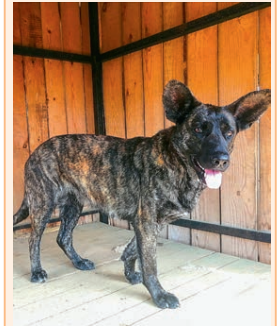
Девочка, размер средний, уши стоячие, большие. Отловлена на ул. Рабочей, 149. Если вы ее узнали, пожалуйста, позвоните.