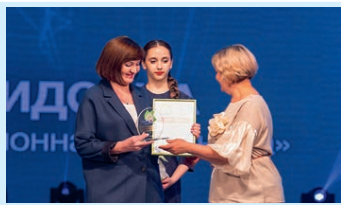
Медики, достойные наград