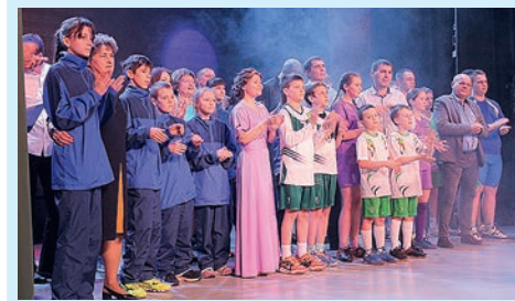
Спортивной школе - 65