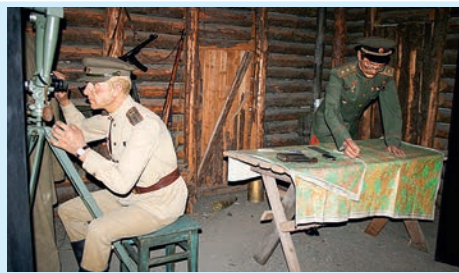
Кино про войну?