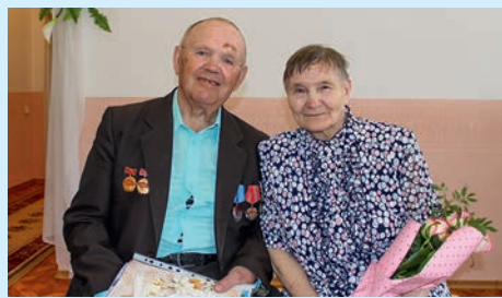
Юбилей, окованный железом