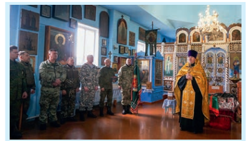
В казачьем полку прибыло Стр. 7