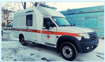
Новая «скорая» для спасения жизней Стр. 2