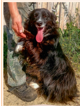
Жуча, 3 года. Маленькая, стерилизованная. Спокойная, тихая, с красивой шерстью. Умеет улыбаться и подавать лапку.