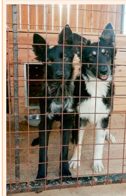
Девочки по кличке Ракета и Торпеда, 6 мес. Среднего размера, активные, ласковые. Ищут себе доброго хозяина.