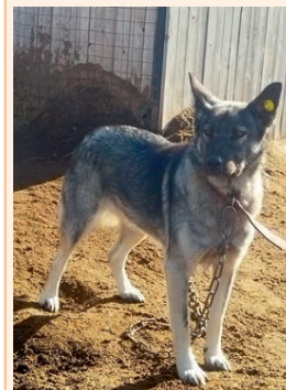
Девочка, 3 года, кличка Муха. Крупная, стерилизованная, спокойная, аккуратная.