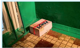
Снова бомба?! Стр. 5