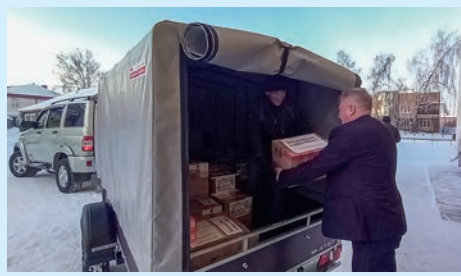
С миру по нитке