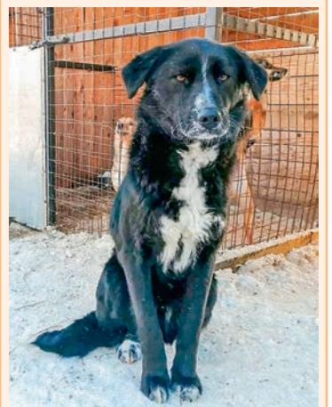
Кобель 1 год. Компаньон, охранник.