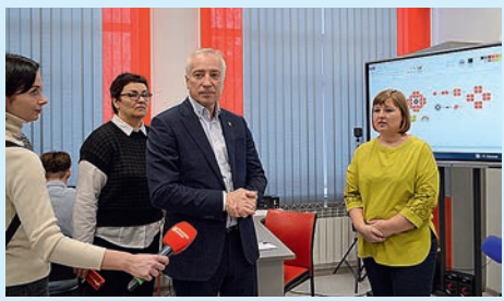
По последнему слову техники