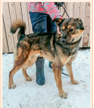
Кобель, 1 год. Крупный, сторожевой.