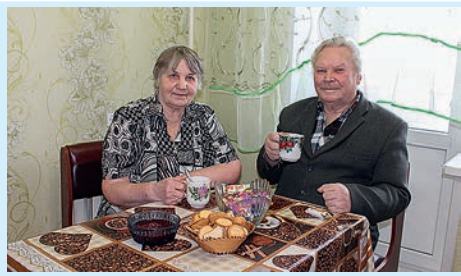
Делиться теплотой души