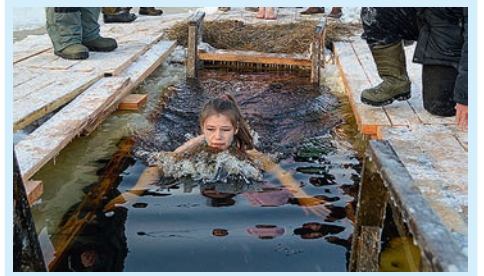
Окунулись в святые воды