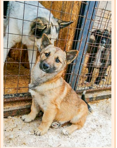
Девочка, 11 мес. Маленькая, игривая, сторожевая.