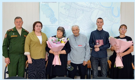
Орден для героя