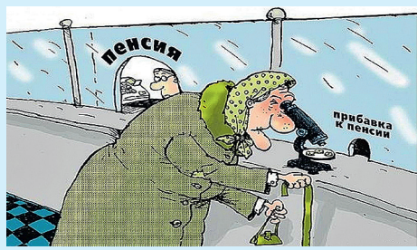
Где рай для пенсионеров? Стр. 3