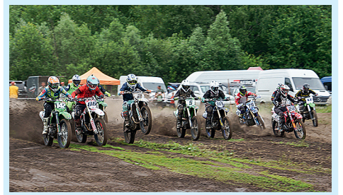
Смельчаки на мототрассе Стр. 8