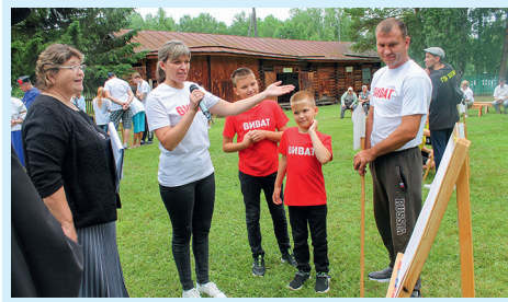
Пусть в сердцах живет любовь! Стр. 5