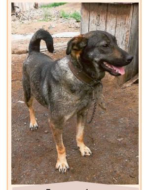
Девочка, 1 год, стерилизована. Размер выше среднего. Хороший сторож, игривая.