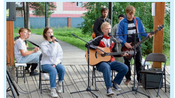
Льются песни под гитару Стр. 8