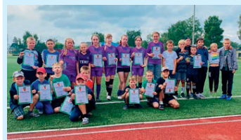
Праздник спорта Стр. 5