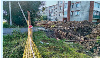
Готовимся к зиме Стр. 7