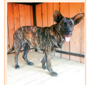
Ищем хозяина для собачки по кличке Нагатака. Размер средний, гладкошерстная, стерилизована, приучена к поводку. Зимой ей в приюте будет тяжело.