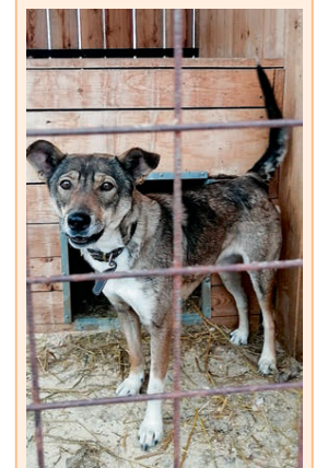
Девочка, стерилизована, среднего размера. Активна, хороший сторож.