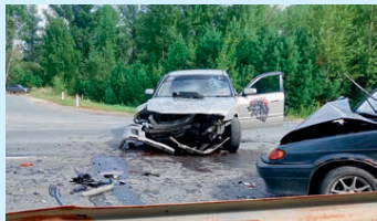
Трасса полна неожиданностей Стр. 2