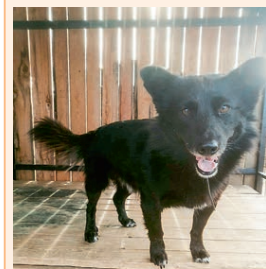
Мальчик, размер меньше среднего, воспитанный, ласковый, чистоплотный, хороший охраннык.