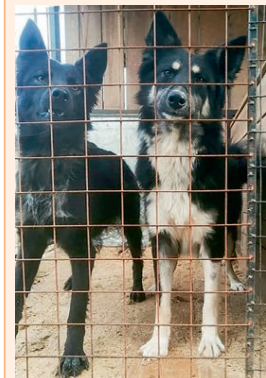
Девочки, возраст 1 год, размер больше среднего, активные, послушные.