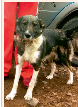
Жужа, стерилизованная, небольшая, ориентирована на человека, обладает охранными качествами.