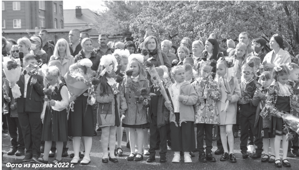
Фото из архива 2022 г.

кровля. Отремонтирована система теплоснабжения в детском саду «Рыбка», на что потребовалось порядка 300 тысяч рублей. Также по предписанию Ростехнадзора в автономных котельных Минаевской и Новониколаевской школ заменены трубы. Как мы сообщали ранее, вскоре должен завершиться долгожданный капитальный ремонт в школе №5 (срок сдачи объекта по контракту - 30 ноября). Пока что начальные классы будут обучаться в Центре творчества детей и молодежи, а ребята с 5 по 9 класс - в школе №1. Однако торжественная линейка в честь Дня знаний для «обитателей» школы №5 состоится все же на территории родного учреждения. Родителей малышей из