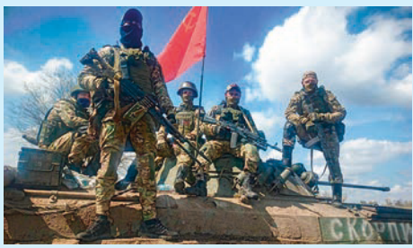
«Против нас не только Европа!» Стр. 5