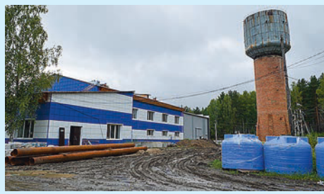
«Нагрелся» на ремонте водозабора Стр. 7