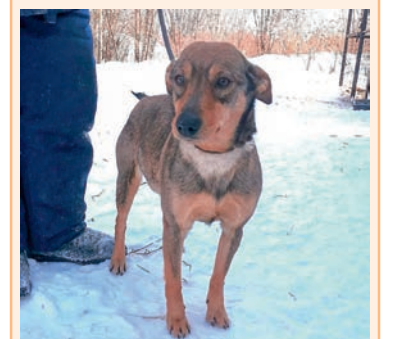
Боня, 4 года. Маленькая, сообразительная, бесстрашная, хороший друг. Подойдет для содержания в квартире.