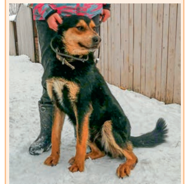
Цезарь, 2 года. Высокий, обладает охранными и сторожевыми качествами. Любит детей, ласковый, хороший компаньон.