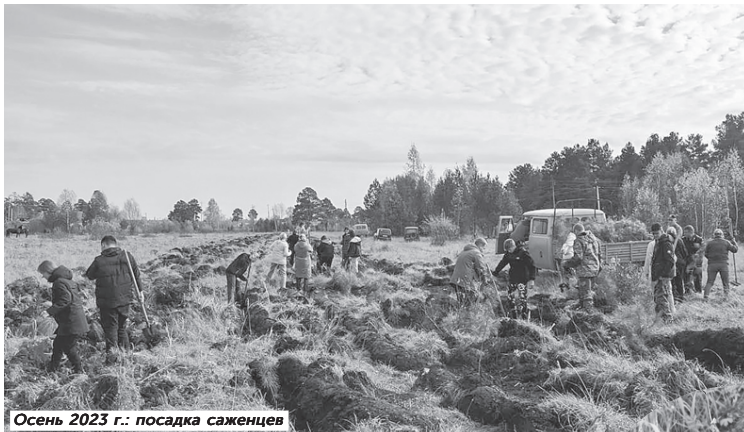
Осень 2023 г.: посадка саженцев