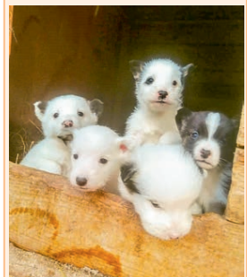
Щенки, возраст 1 месяц, вырастут средними, очень симпатичные.