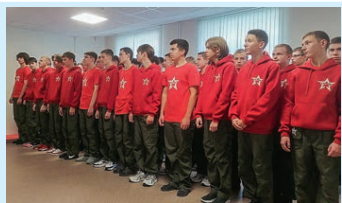
Школа для настоящих мужчин Стр. 2