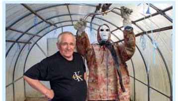
От скуки на все руки! Стр. 8