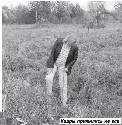
Кедры прижились не все

красного словца, а сначала изучить вопрос, следить и ухаживать за саженцами, опять же.