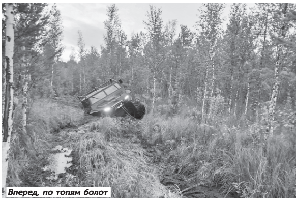
Вперед, по топям болот

Наутро выдвинулись по другому пути, по старой узкоколейке. Лестю спускался, то светился пропеллинами олешек. Каково же было удивление и даже страх, когда в этой глуши навстречу им попался огромный железный монстр с шупальцем - харвестер. Пришлось немало потрудиться, чтобы разехать на узенькой дорожке.