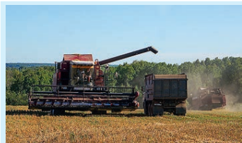
Слава хлеборобам! Стр. 3