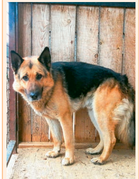
Юлдаш, верный, в меру агрессивный. Нужен опытный хозяин.