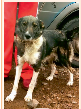
Жужа, стерилизована, небольшая, ориентирована на человека, обладает охранными качествами.