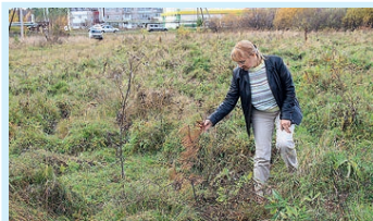
Вырастут ли кедры? Стр. 5