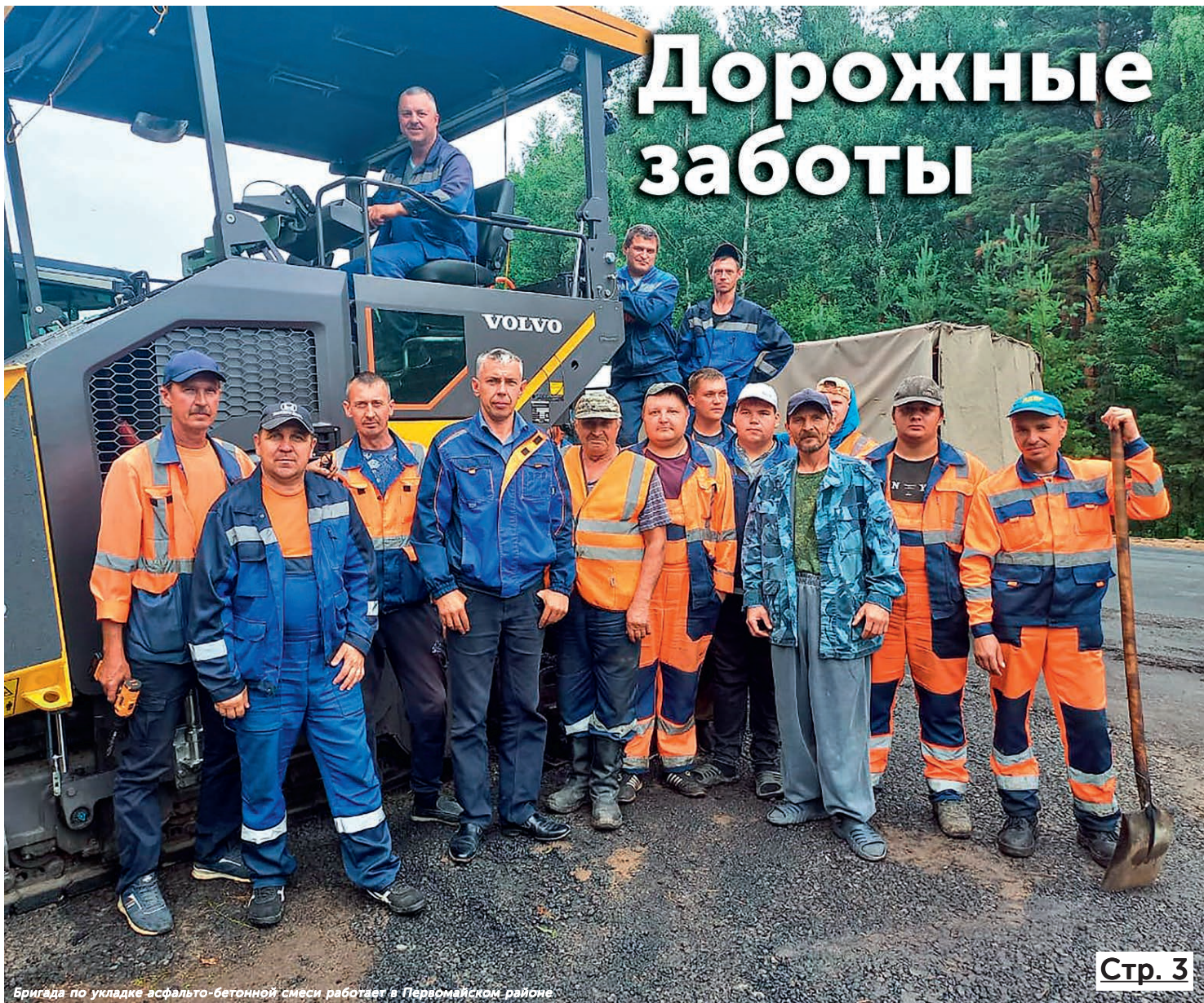
Бригада по укладке асфальто-бетонной смеси работает в Первомайском районе