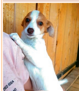
Девочка, 3 месяца. Маленькая, изящная, гладкошерстная. Вырастет меньше спаниеля. Подойдет для содержания в квартире. Она еще маленькая, а взгляд и поведение как у взрослой собаки.