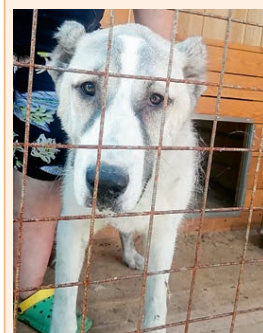
Девочка, 9 месяцев, порода алабай. Отловлена 18 июля по адресу: ул. Ленина, 63. Хозяин, отзовись.