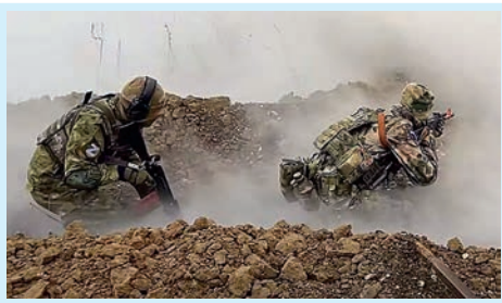
Воины ушли в небеса