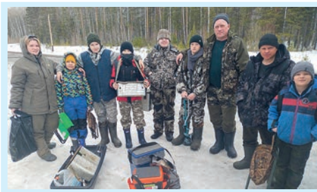
Из юнармейцев в рыбаки