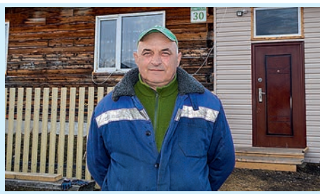
Без дела в жизни нет смысла