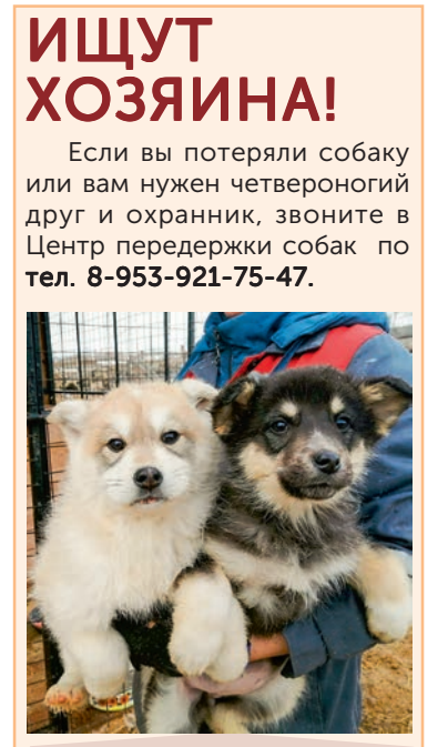
Девочки, 2 мес. Вырастают средними.