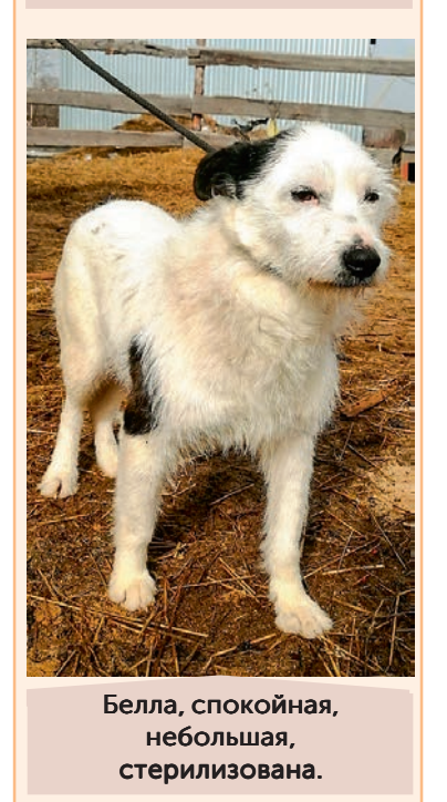
Белла, спокойная, небольшая, стерилизована.