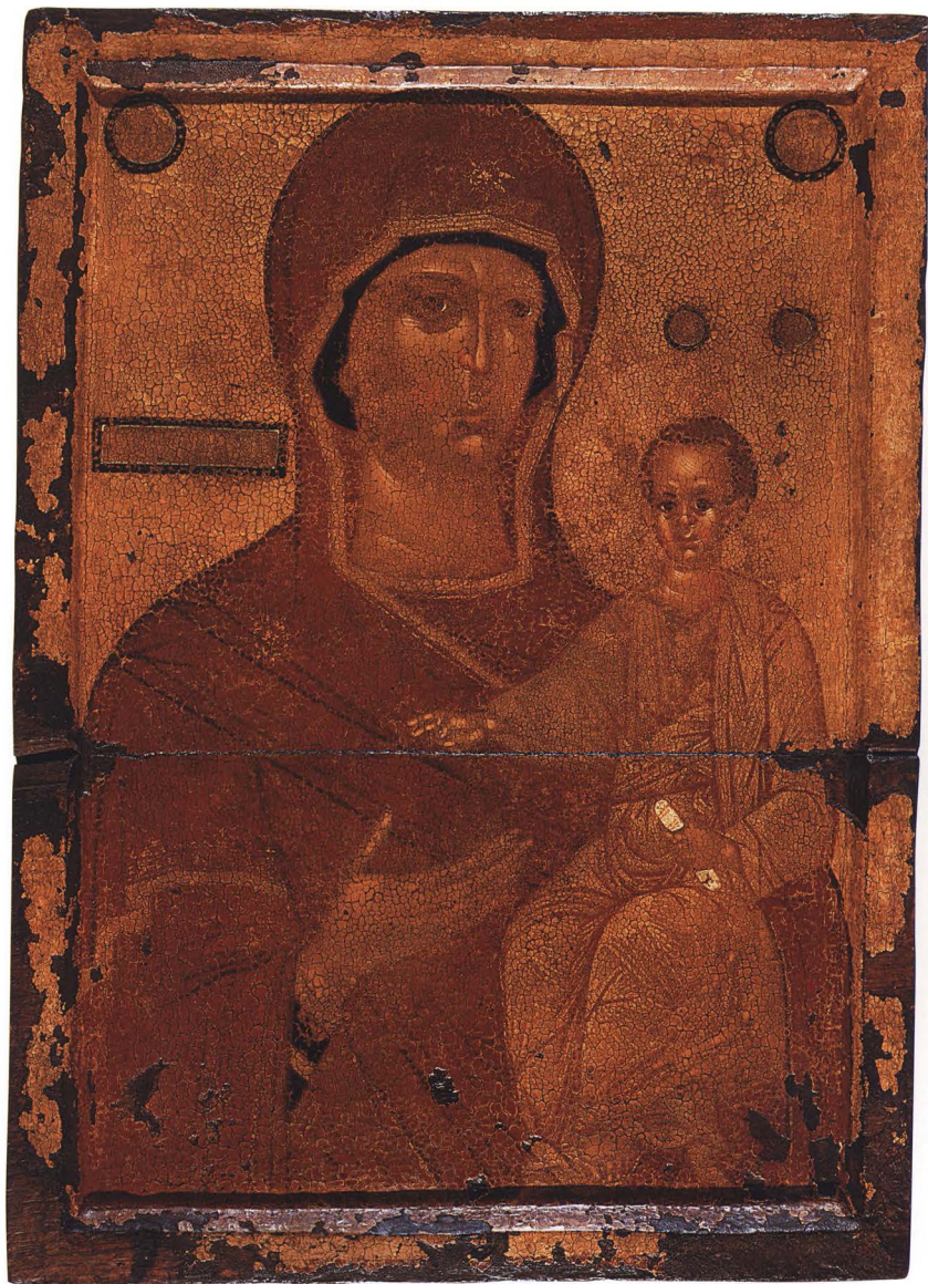
2. БОГОМАТЕРЬ ОДИГИТРИЯ Середина XV в. Македония. КАТ. 2