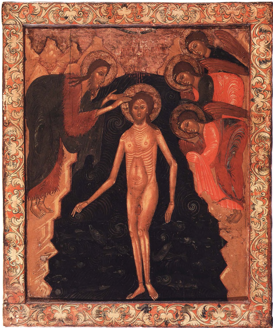
34. БОГОЯВЛЕНИЕ Двухсторонняя икона. Вторая половина XVII в. Русский Север. КАТ. 76