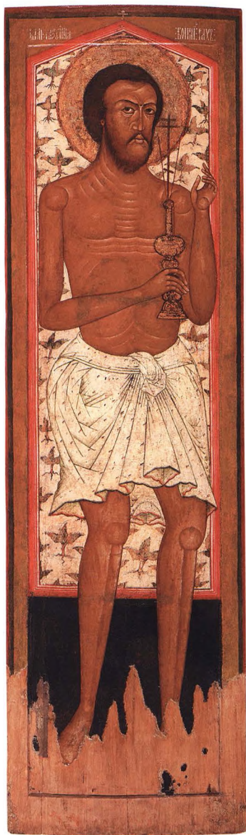
35. БЛАГОРАЗУМНЫЙ РАЗБОЙНИК Дверь в жертвенник. Вторая половина XVII в. Средняя Русь. кат. 77