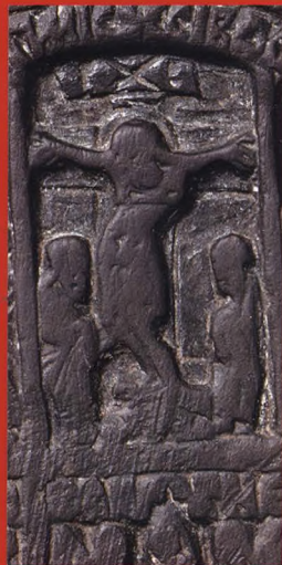
ИКОНА. ШЕСТЬ ПРАЗДНИКОВ Конец XV в.