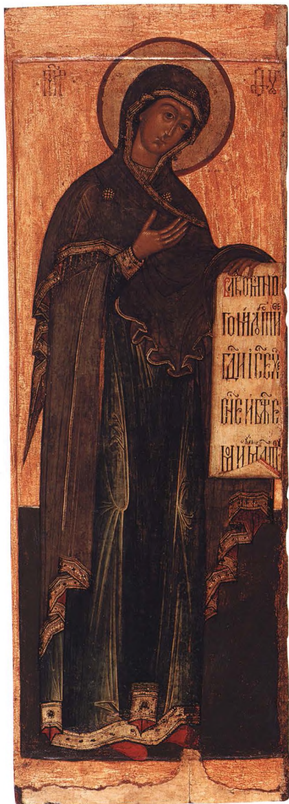
30. БОГОМАТЕРЬ Из деисуса. Третья четверть XVII в. Поволжье. КАТ. 67