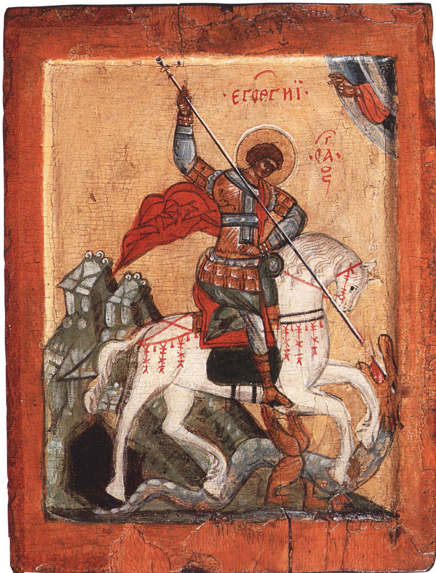
6. ЧУДО ГЕОРГИЯ О ЗМИЕ Первая треть XVI в. Новгородская провинция (Обонежье-?). КАТ. 7