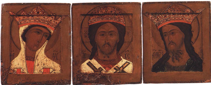
21. СПАС ВЕЛИКИЙ АРХИЕРЕЙ. БОГОМАТЕРЬ. ИОАНН ПРЕДТЕЧА Деисус. Начало XVII в. Строгановский мастер (?). КАТ. 38 – 40