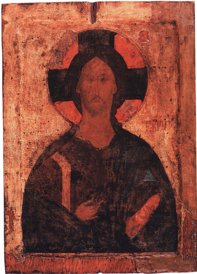
3. СПАС ВСЕДЕРЖИТЕЛЬ Первая половина XV в. Ростов (?). КАТ. 3