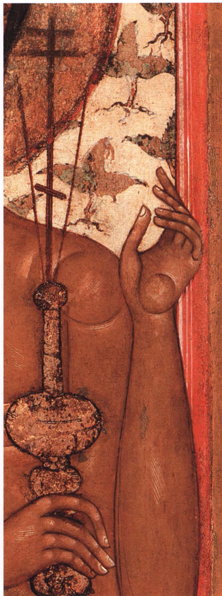
35. БЛАГОРАЗУМНЫЙ РАЗБОЙНИК Деталь