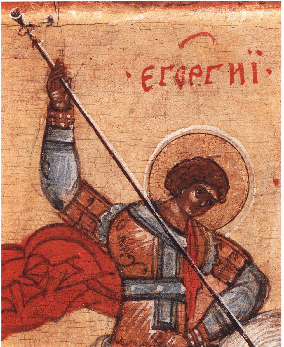
6. ЧУДО ГЕОРГИЯ О ЗМИЕ Деталь