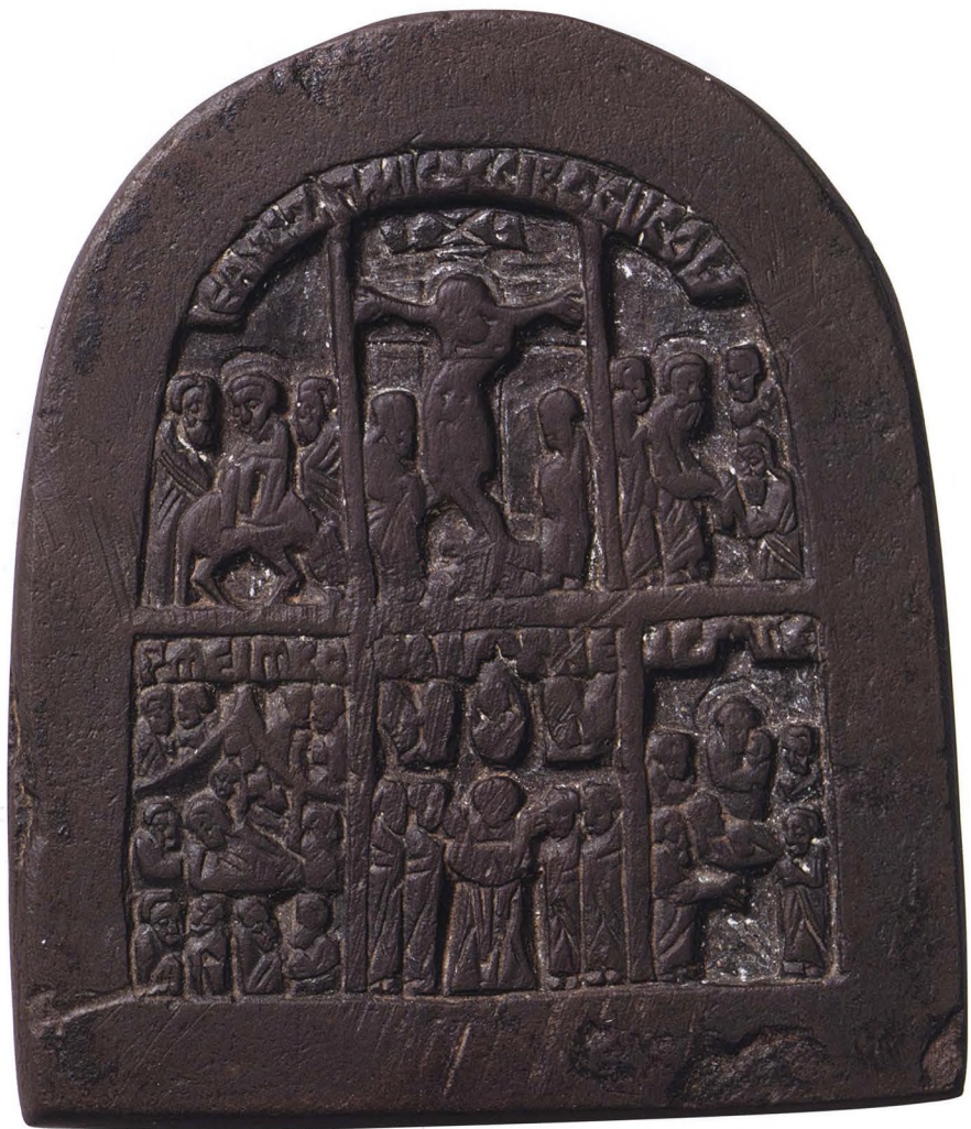
46. ИКОНА. ШЕСТЬ ПРАЗДНИКОВ Конец XV в. КАТ. 224