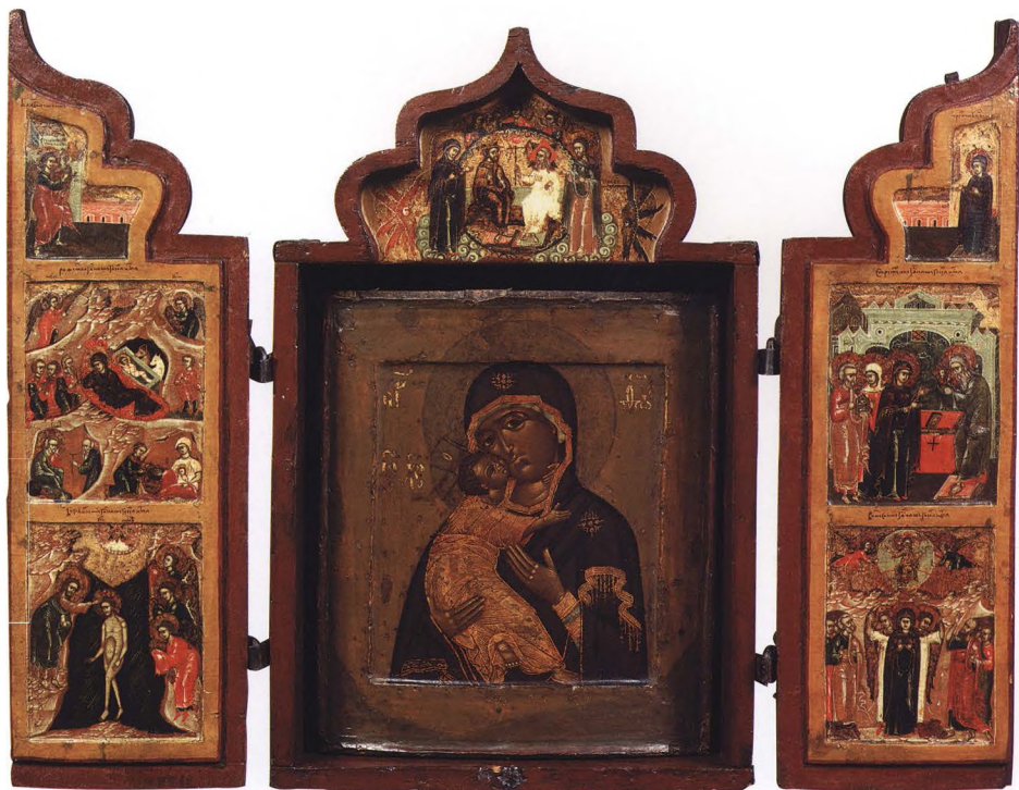
24. БОГОМАТЕРЬ ВЛАДИМИРСКАЯ И КУЗОВ С ТРОИЦЕЙ НОВОЗАВЕТНОЙ В НАВЕРШИИ И ПРАЗДНИКАМИ НА СТВОРКАХ Первая половина XVII в. Москва (?), вторая половина XVII в. КАТ. 48, 73