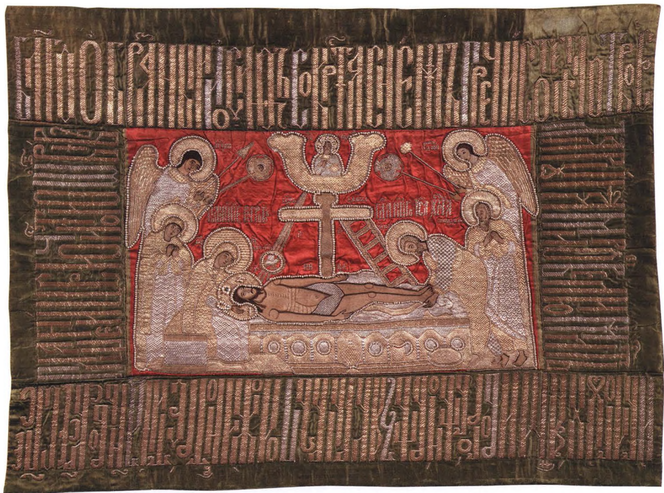
51. ВОЗДУХ. ПОЛОЖЕНИЕ ВО ГРОБ Последняя треть XVII в. Ярославль. КАТ. 351