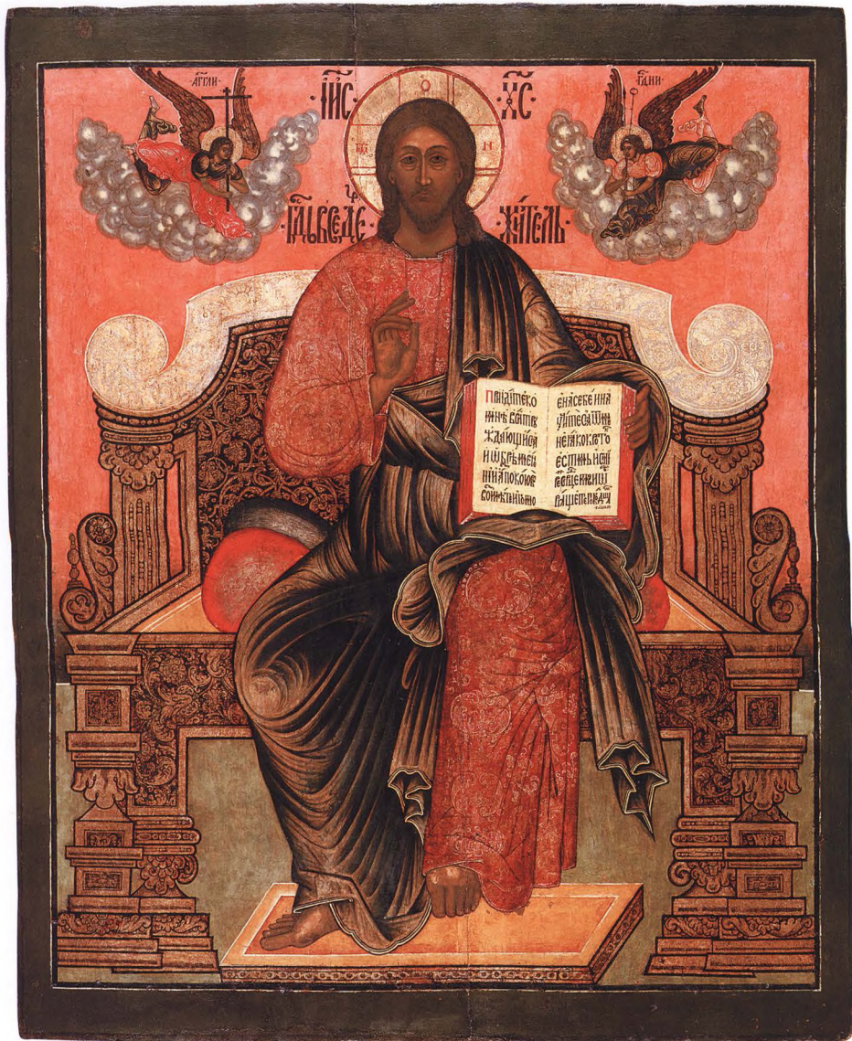
38. СПАС НА ТРОНЕ Начало XVIII в. КАТ. 100