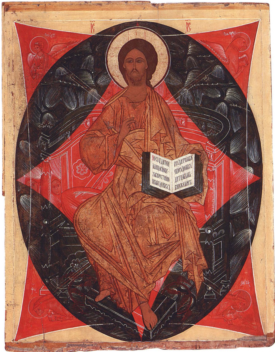
8. СПАС В СИЛАХ Вторая четверть XVI в. Тверь – Новгород. КАТ. 10