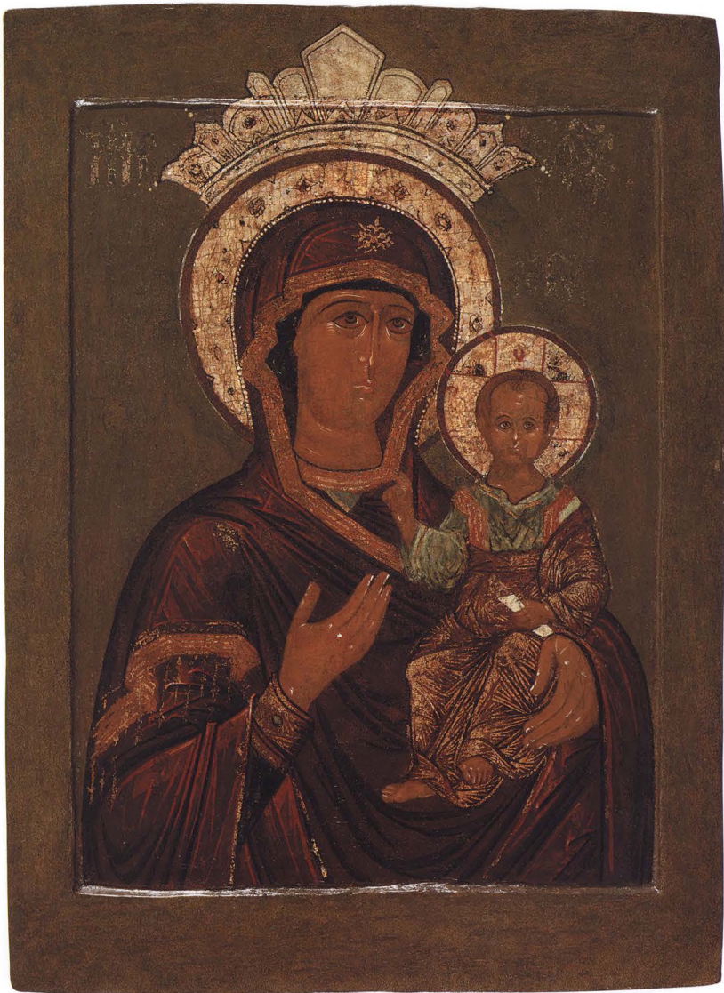
26. БОГОМАТЕРЬ ОДИГИТРИЯ Первая половина XVII в. КАТ. 51