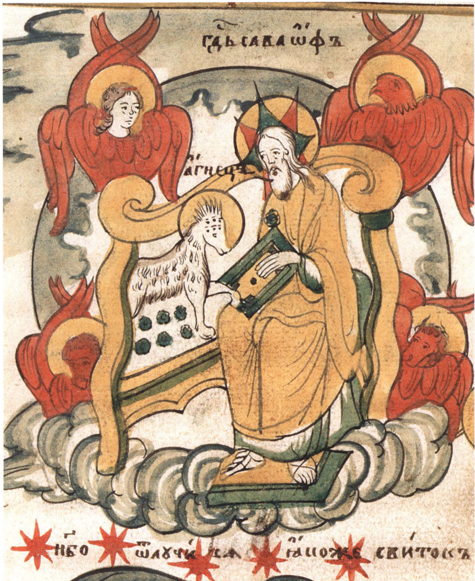
53. АПОКАЛИПСИС ТРЕХТОЛКОВЫЙ И СЛОВО О ВТОРОМ ПРИШЕСТВИИ ХРИСТОВОМ Деталь