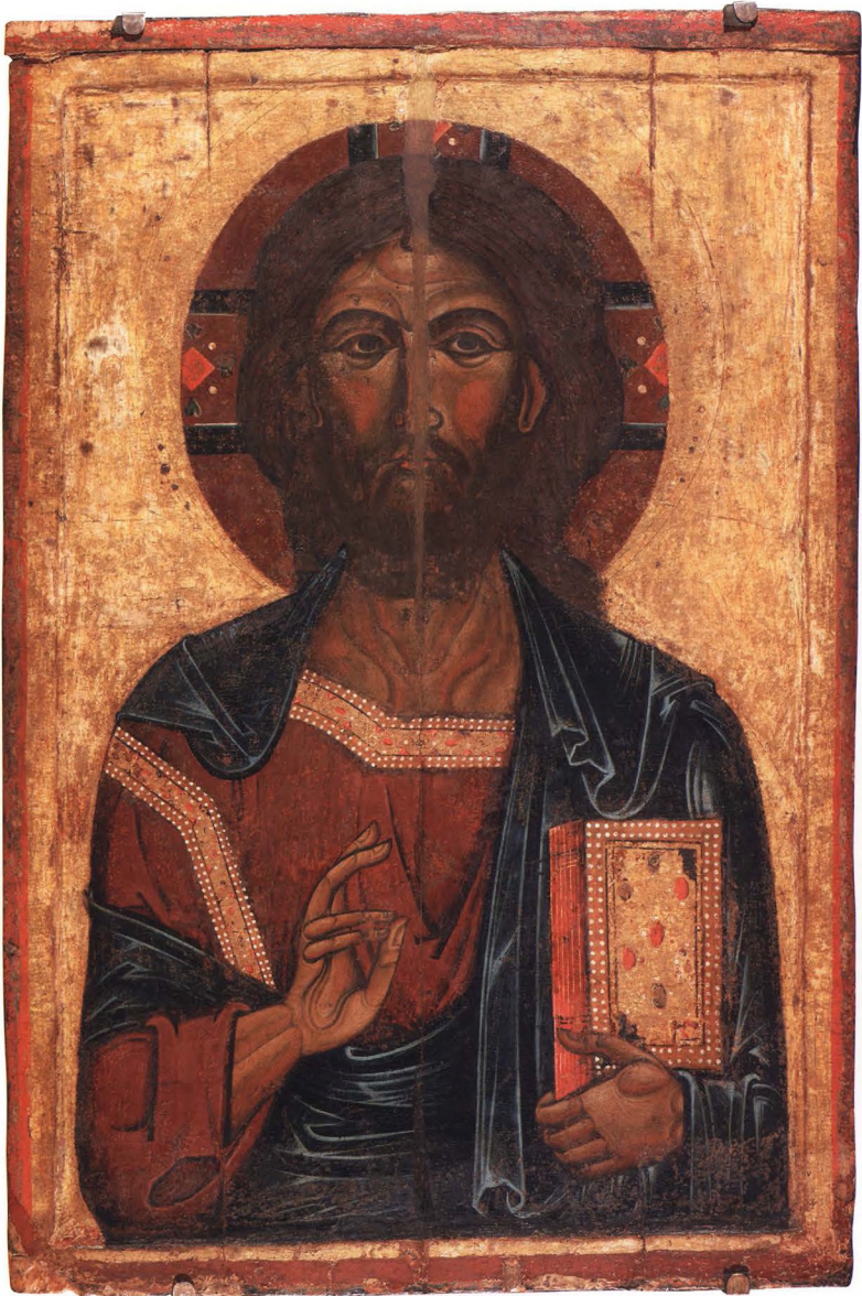
1. СПАС ВСЕДЕРЖИТЕЛЬ Первая половина XIII в. Ростов-Ярославль (?). КАТ. 1