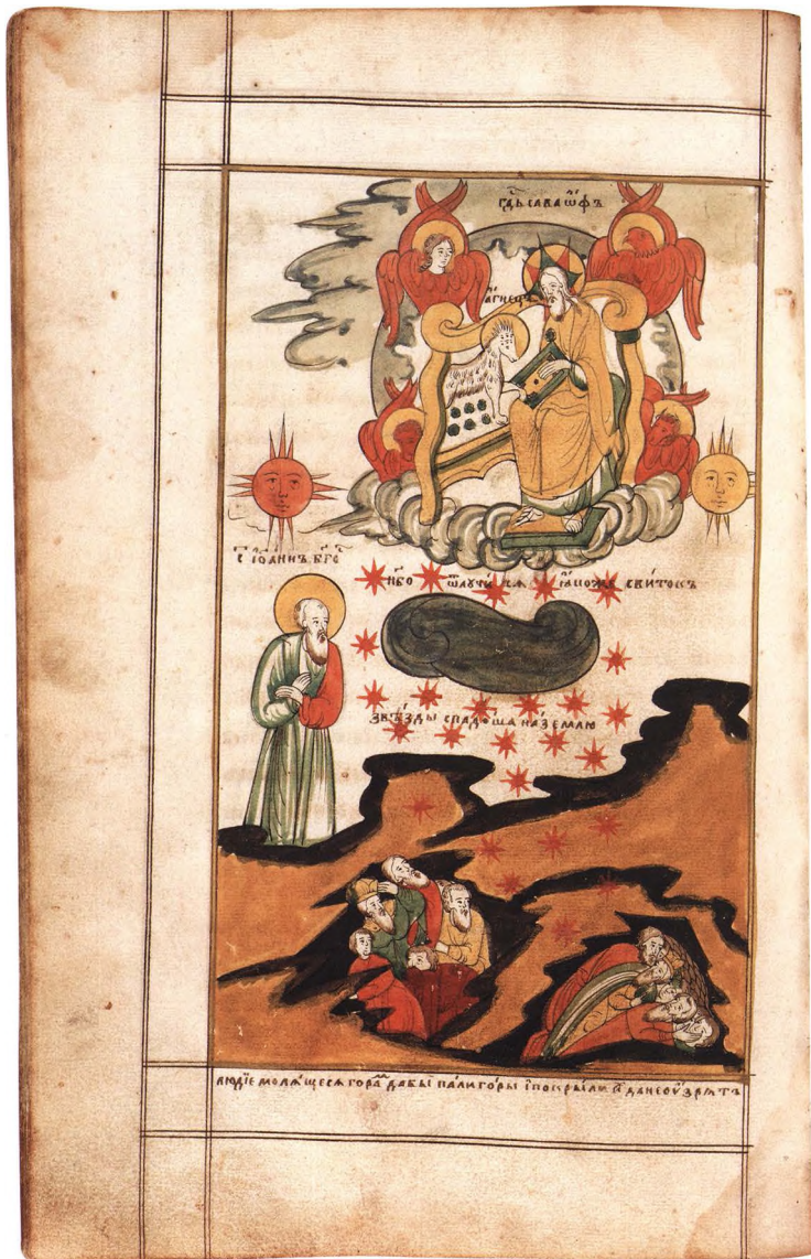
53. АПОКАЛИПСИС ТРЕХТОАКОВЫЙ И СЛОВО О ВТОРОМ ПРИШЕСТВИИ ХРИСТОВОМ ПАЛЛАДИЯ МНИХА, ЛИЦЕВОЙ Конец XVII – начало XVIII в. КАТ. 375