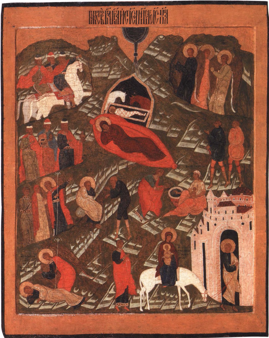
25. РОЖДЕСТВО ХРИСТОВО Первая половина XVII в. Русский Север. КАТ. 50