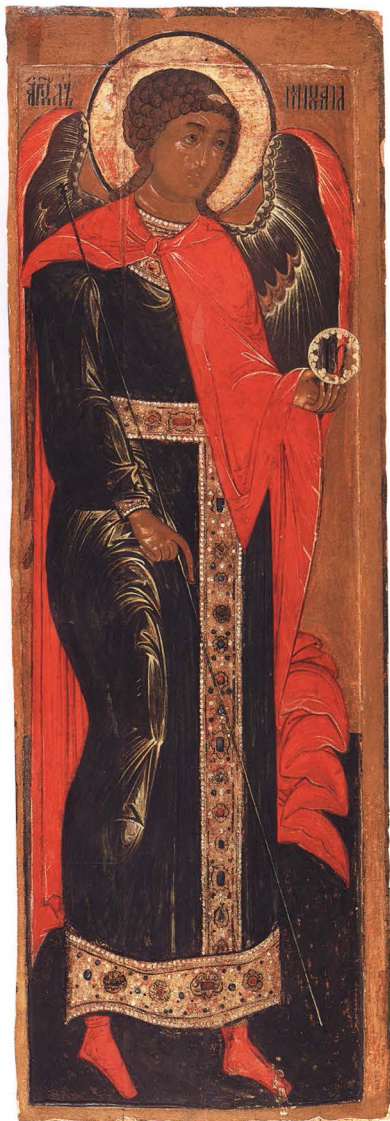
31. АРХАНГЕЛ МИХАИЛ Третья четверть XVII в. Поволжье. КАТ. 60