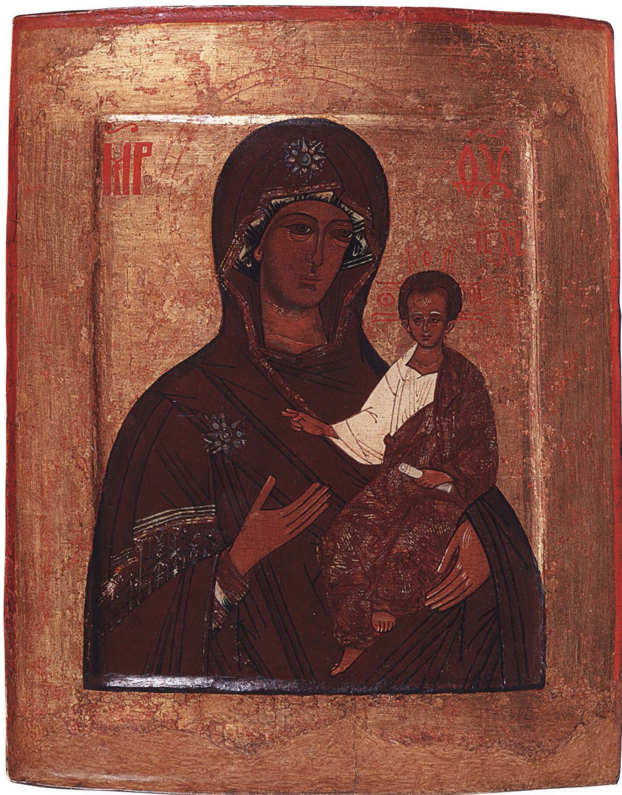
7. БОГОМАТЕРЬ СМОЛЕНСКАЯ Первая половина – середина XVI в. Русский Север. КАТ. 9