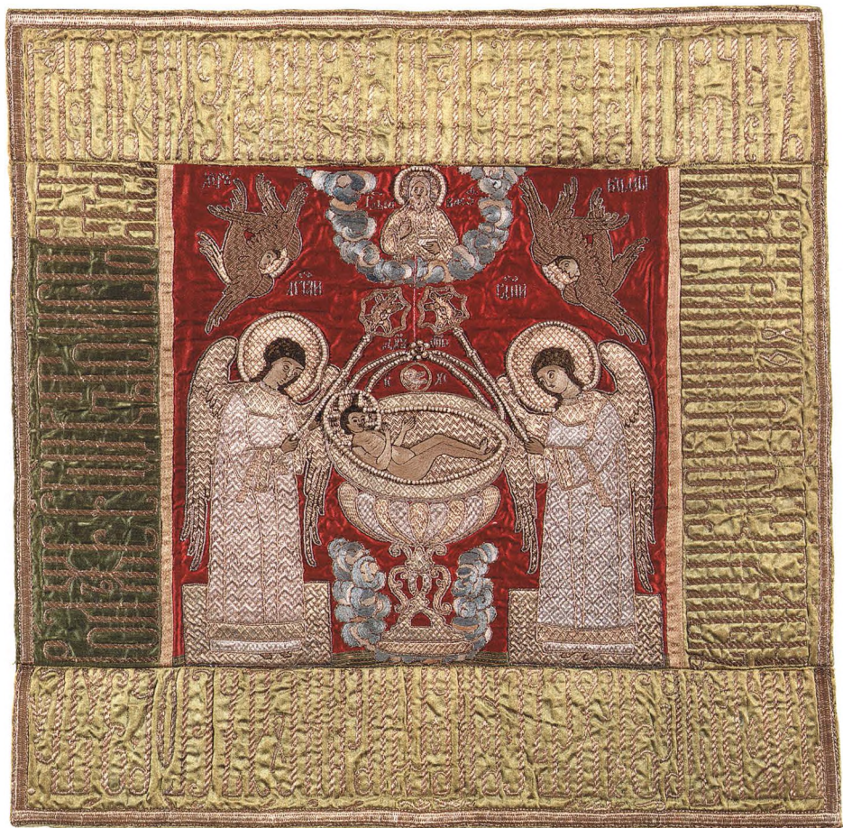
49. ПОКРОВЕЦ. СЕ АГНЕЦ Последняя треть XVII в. Ярославль. КАТ. 352