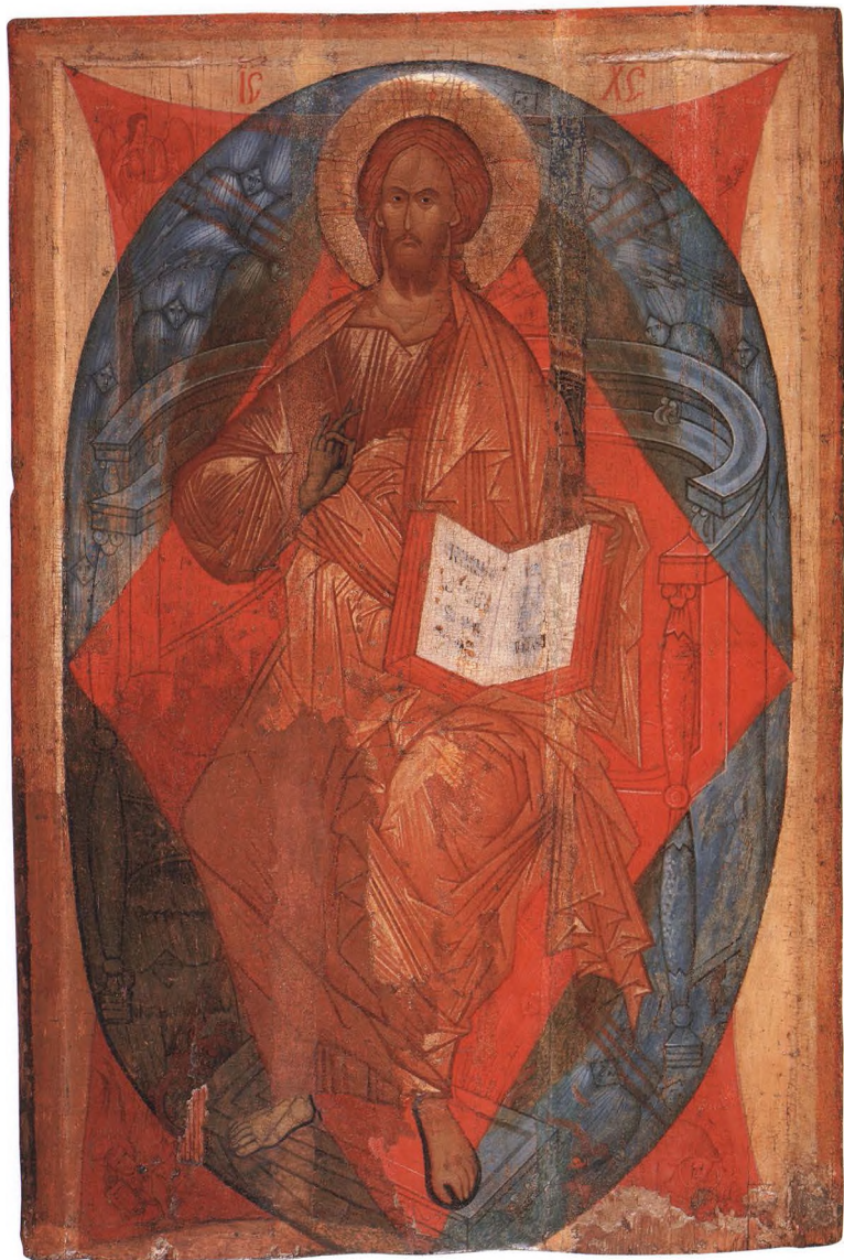
4. СПАС В СИЛАХ Конец XV в. Ростов. КАТ. 4