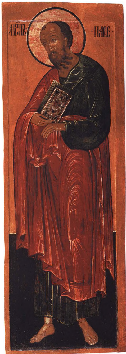
29. АПОСТОЛ ПАВЕЛ Из деисуса. Середина – третья четверть XVII в. Ярославская провинция. КАТ. 61