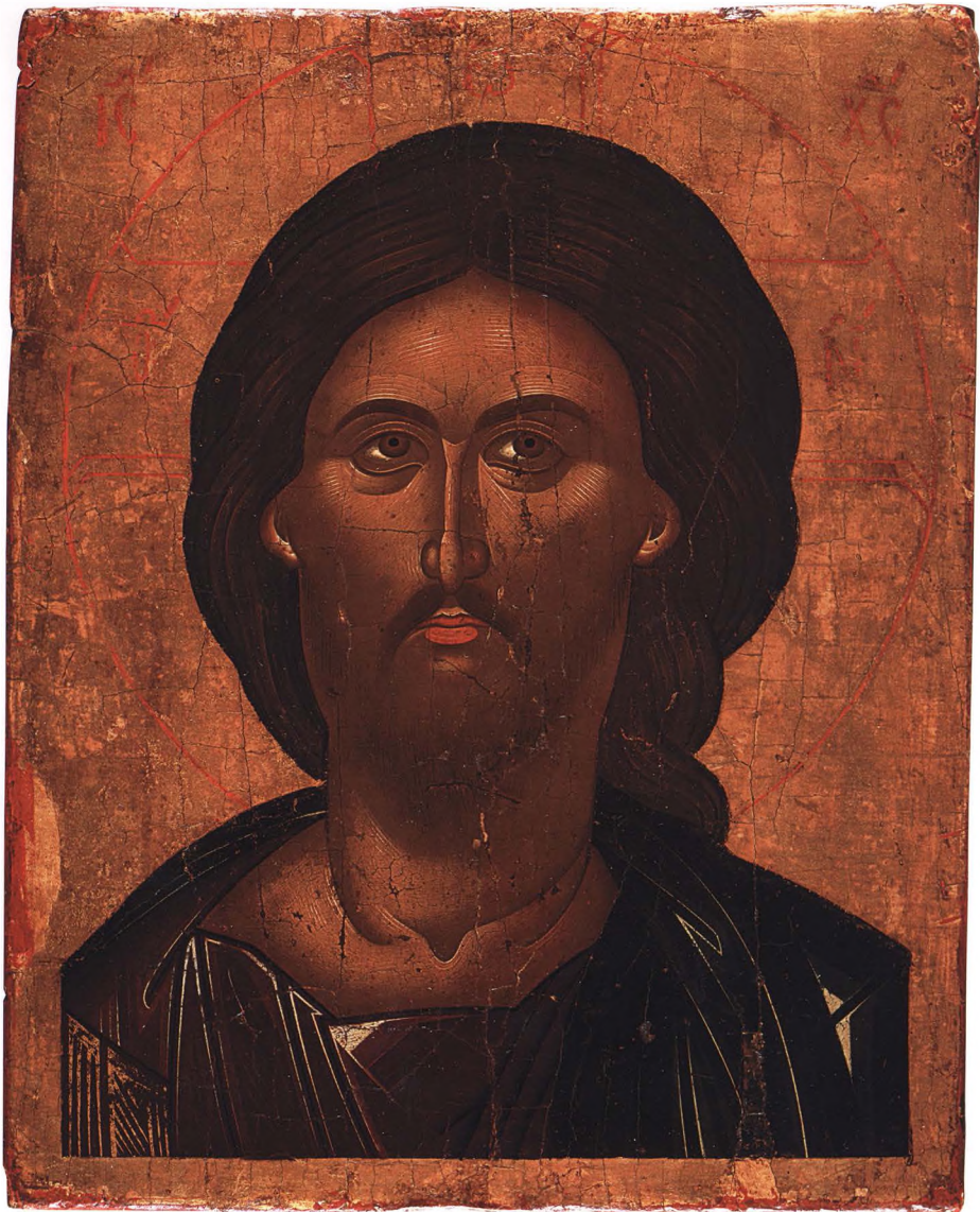
14. СПАСИТЕЛЬ Середина XVI в. Крит. КАТ. 18