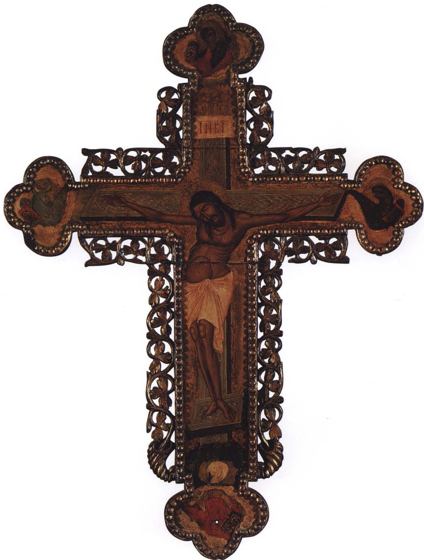
20. РАСПЯТИЕ ХРИСТОВО. КРЕСТ НАДЫКОНОСТАСНЫЙ Около 1600 г. Сербия. КАТ. 37