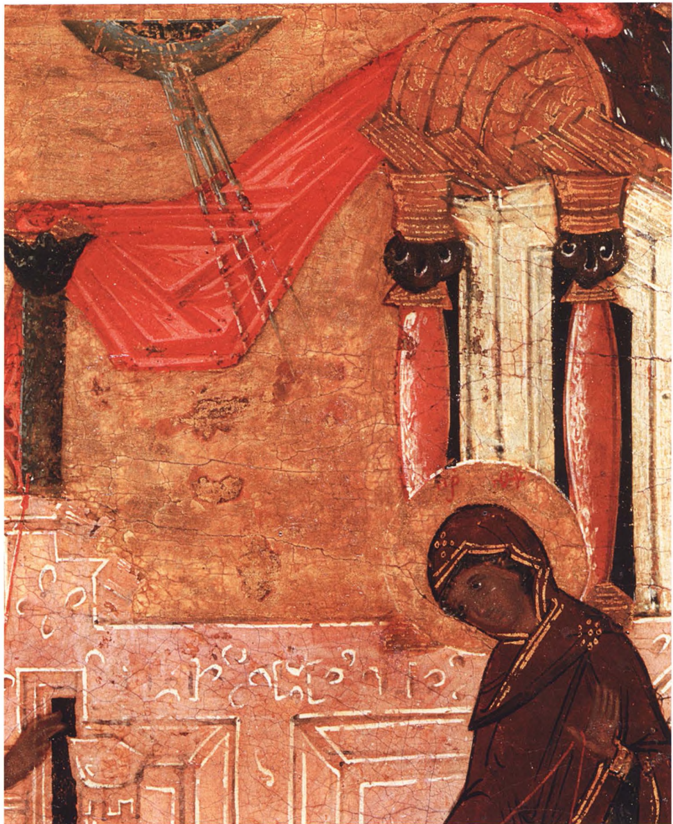
12. БЛАГОВЕЩЕНИЕ. ДВУХСТОРОННЯЯ ТАБЛЕТКА Деталь