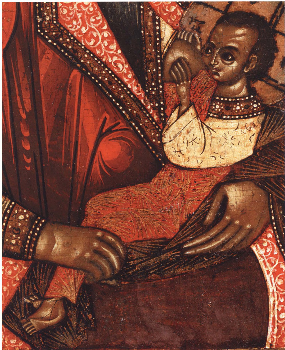
37. БОГОМАТЕРЬ МАЛКОПИТАТЕЛЬНИЦА Деталь