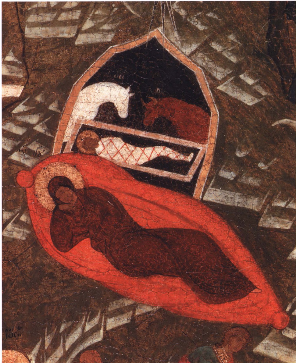
25. РОЖДЕСТВО ХРИСТОВО Деталь