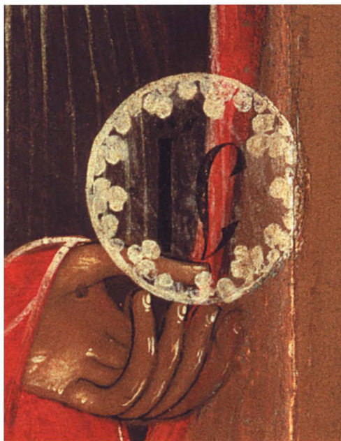
31. АРХАНГЕЛ МИХАИЛ Деталь