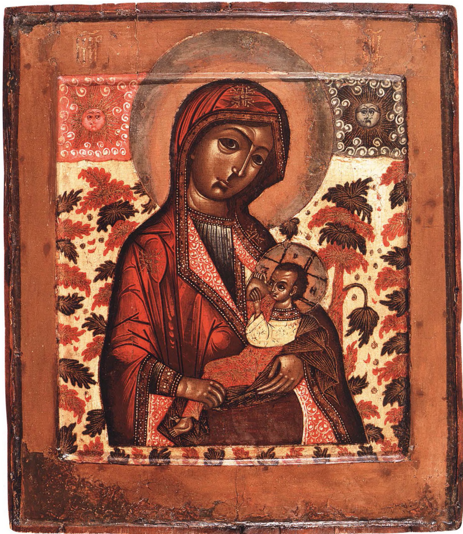
37. БОГОМАТЕРЬ МАЕКОПИТАТЕЛЬНИЦА Конец XVII – начало XVIII в. КАТ. 96