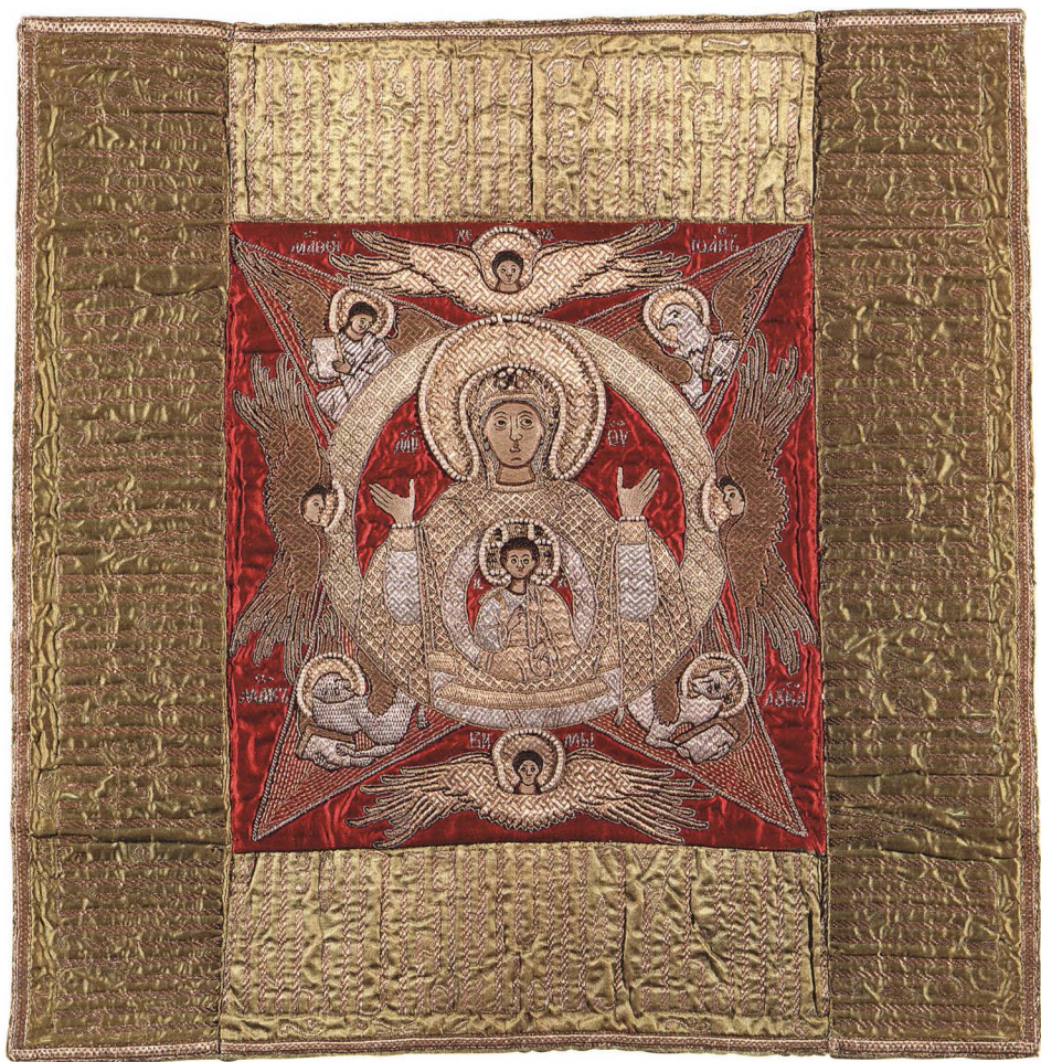
50. ПОКРОВЕЦ. БОГОМАТЕРЬ ЗНАМЕНИЕ Последняя треть XVII в. Ярославль. КАТ. 353