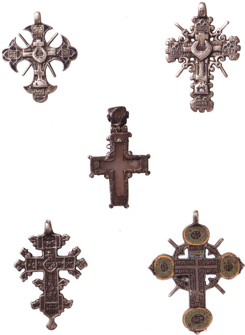
47. СЕРЕБРЯНЫЕ КРЕСТЫ-ТЕПЛИКИ XVI – XVIII вв. КАТ. 241, 240, 236, 252, 244