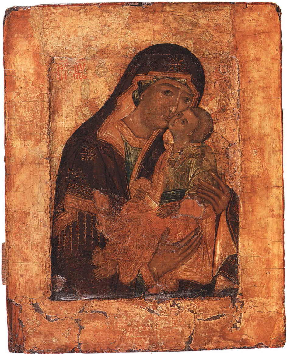
16. БОГОМАТЕРЬ УМИЛЕНИЕ Третья четверть XVI в. Москва (?). КАТ. 21