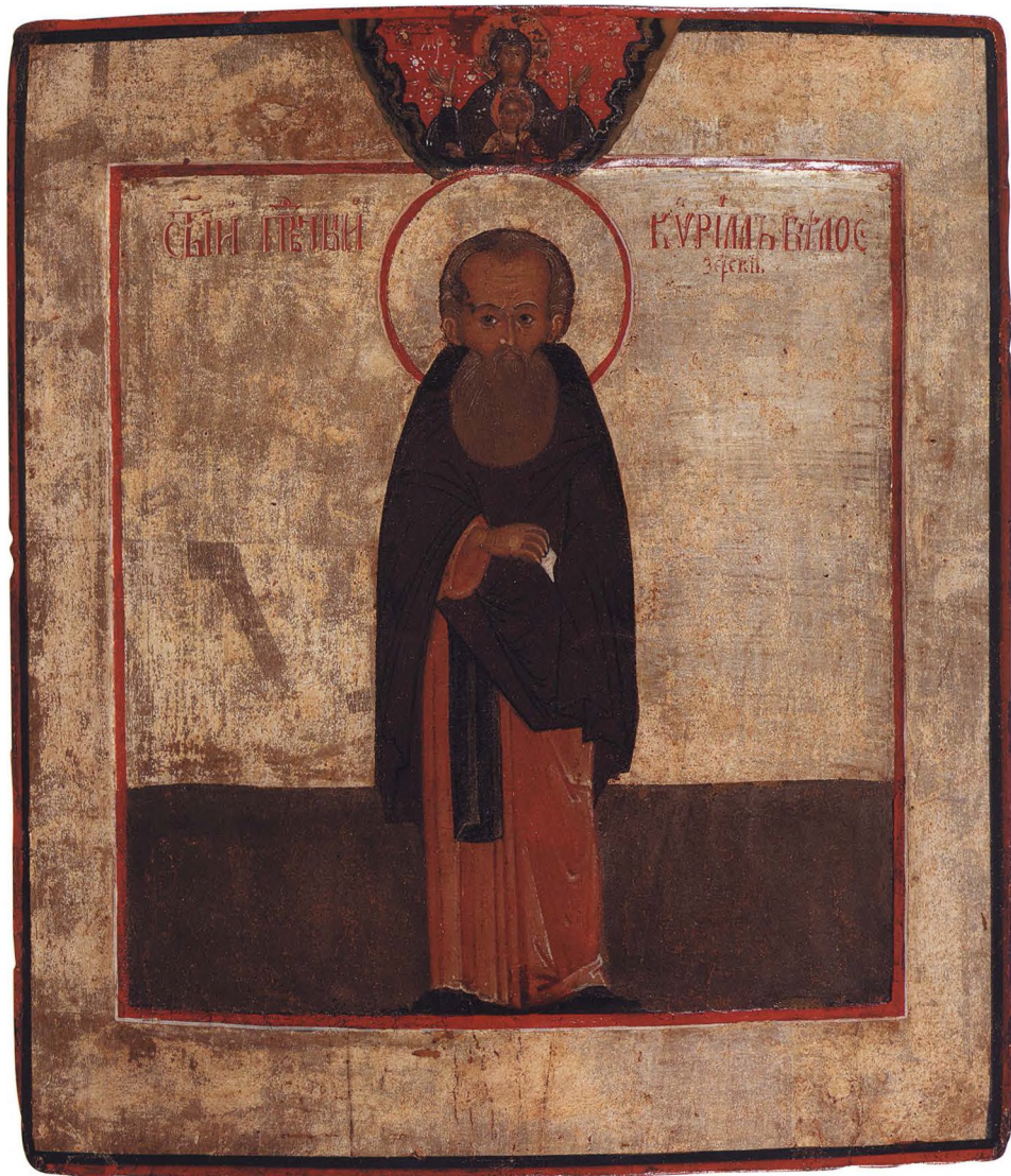
27. ПРЕПОДОБНЫЙ КИРИЛ БЕЛОЗЕРСКИЙ Середина XVII в. Русский Север. КАТ. 57