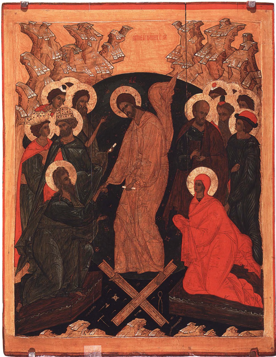
9. СОШЕСТВИЕ ВО АД Вторая четверть XVI в. Новгород – Верхнее Поволжье. КАТ. 11