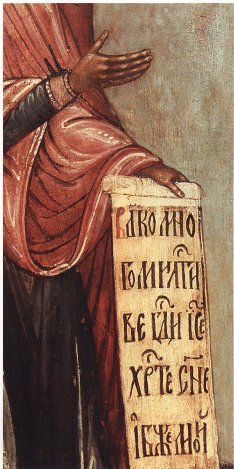
32. БОГОМАТЕРЬ. ИЗ ДЕИСУСА Деталь