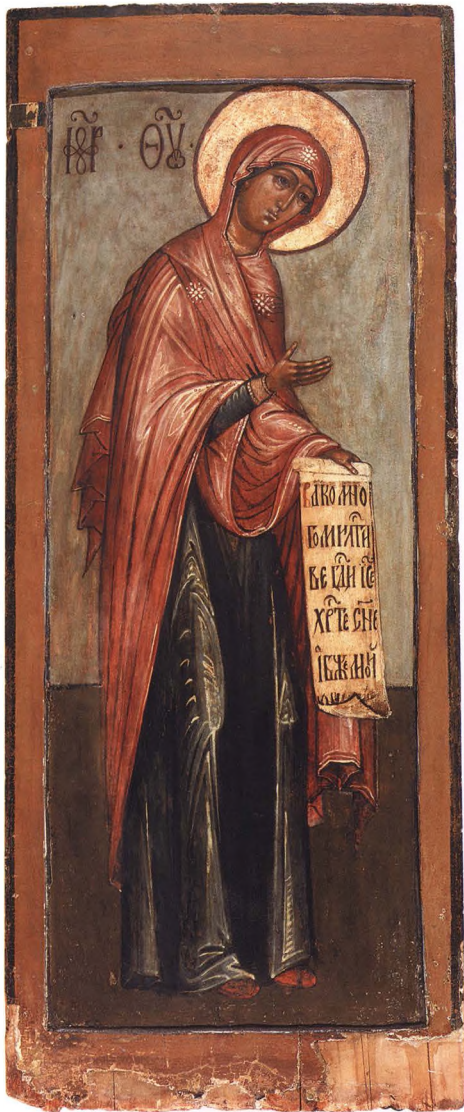
32. БОГОМАТЕРЬ. ИЗ ДЕИСУСА Вторая половина XVII в. КАТ. 74