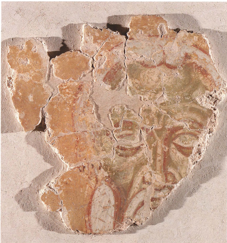
43. СВЯТИТЕЛЬ ДОМЕТИАН МЕЛИТИНСКИЙ. Фрагмент 1199 г. Новгород. КАТ. 175