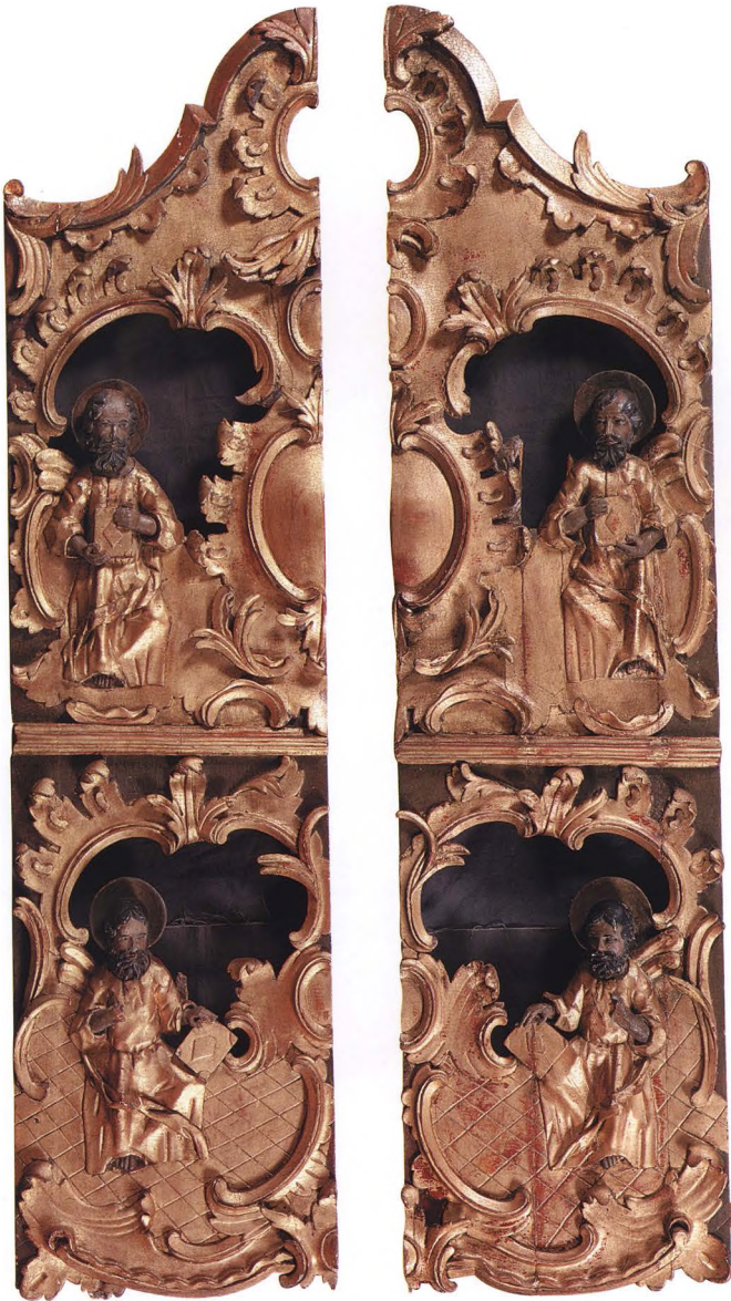
48. ЦАРСКИЕ ВРАТА Вторая половина XVIII в. КАТ. 356