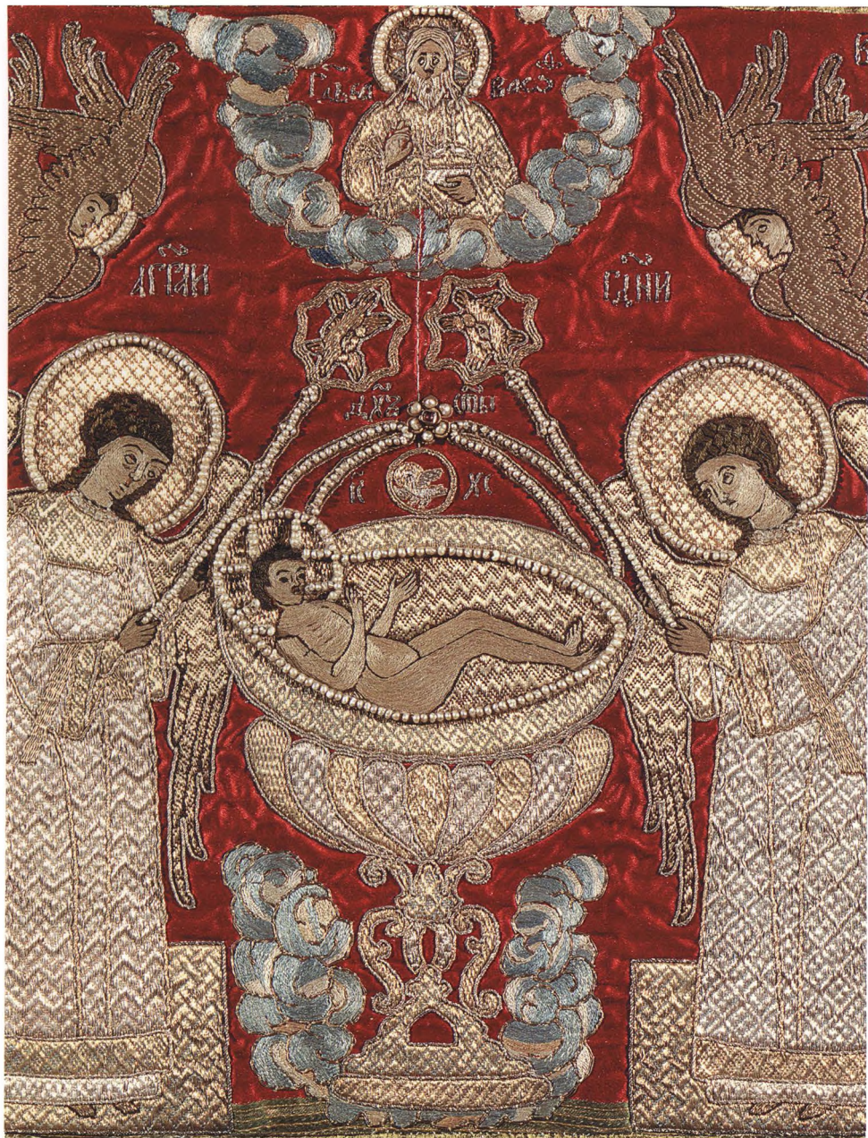
49. ПОКРОВЕЦ. СЕ АГНЕЦ Деталь