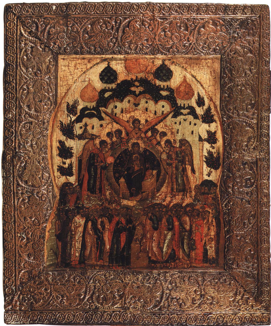
17. О ТЕБЕ РАДУЕТСЯ Третья четверть XVI в. Новгород. КАТ. 22