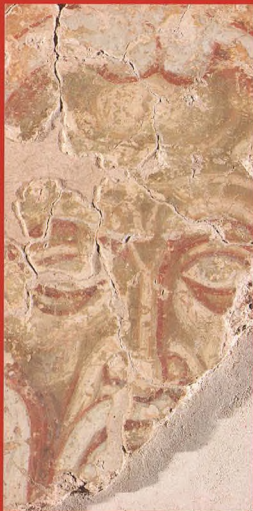
СВЯТИТЕЛЬ ДОМЕТИАН МЕЛИТИНСКИЙ 1199 г. Новгород