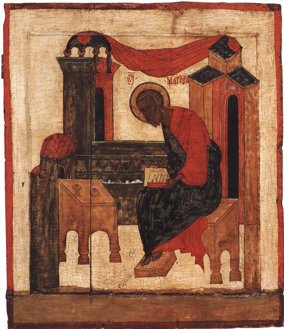
18. ЕВАНГЕЛИСТ МАТФЕЙ Спидок с правой стороны царских врат. Вторая половина XVI в. Средняя Русь. КАТ. 28