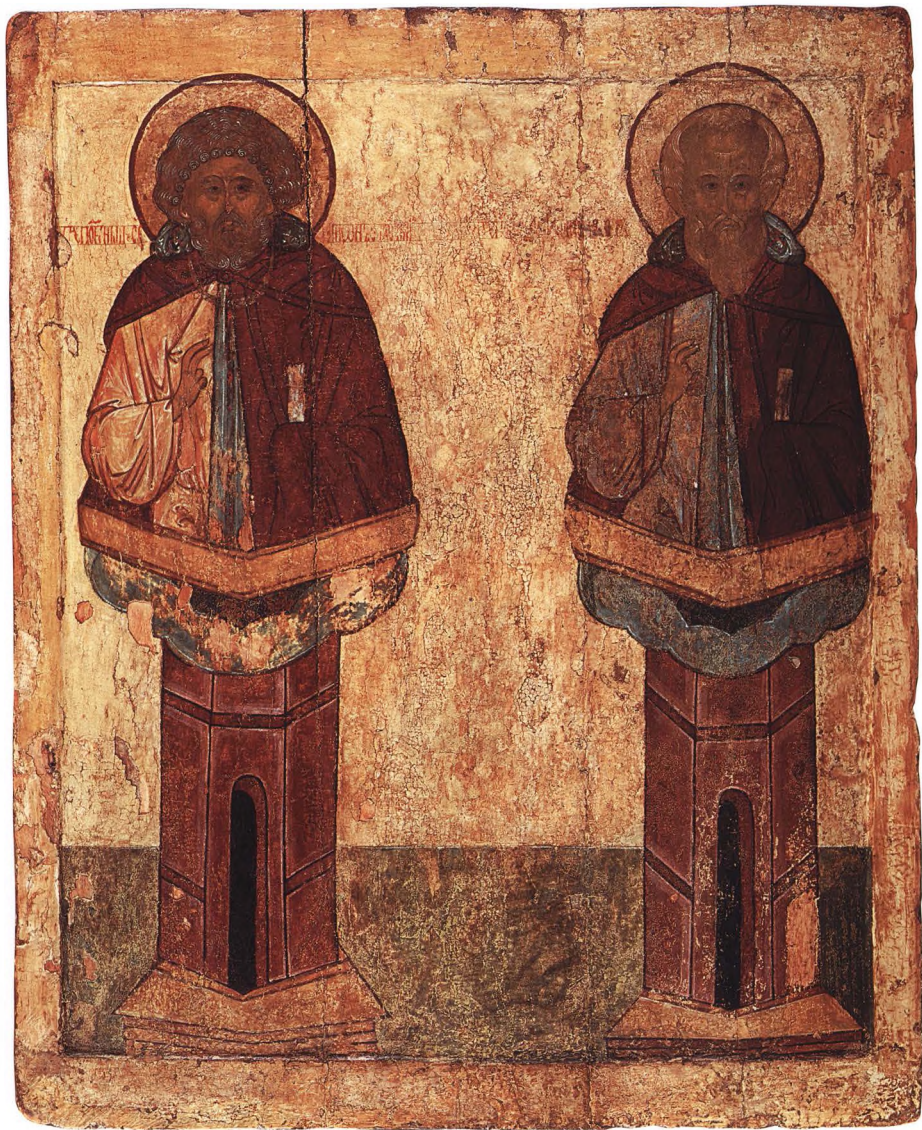
13. СТОЛПНИКИ СИМЕОН И ДАНИИЛ Середина XVI в. Новгород – Ростов. КАТ. 17