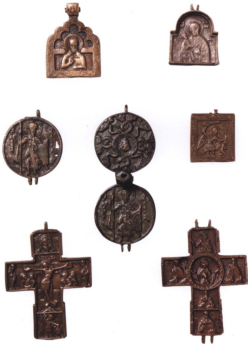
45. МЕДНОЛИТАЯ ПЛАСТИКА XIII – XVII вв. КАТ. 238, 230, 207, 206, 233, 234, 235