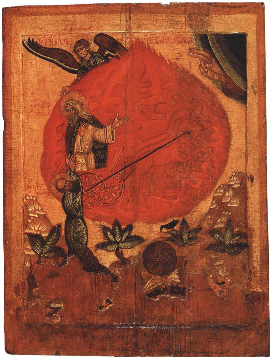
19. ОГНЕННОЕ ВОСХОЖДЕНИЕ ПРОРОКА ИЛИИ Конец XVI – начало XVII в. Русский Север.