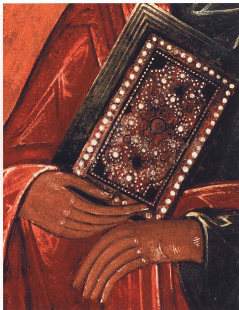
31. АПОСТОЛ ПАВЕЛ Деталь