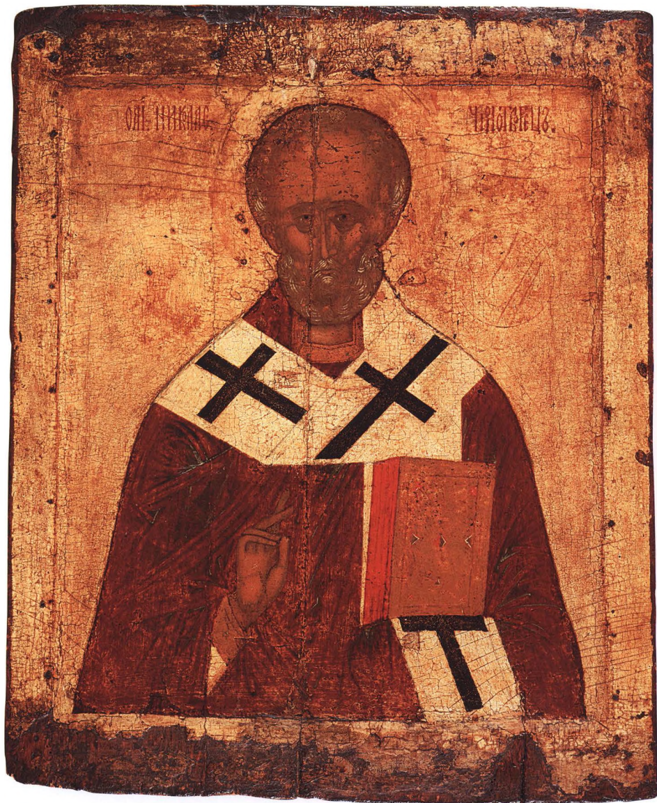
11. СВЯТИТЕЛЬ НИКОЛАЙ ЧУДОТВОРЕЦ Середина XVI в. Ростов. КАТ. 14