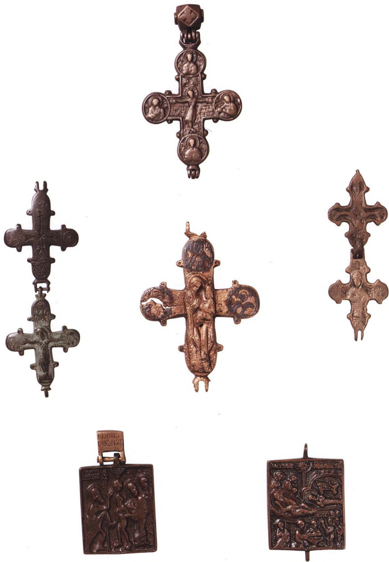
44. МЕДНОЛИТАЯ ПЛАСТИКА XI – XIV вв. КАТ. 202, 197, 199, 195, 217