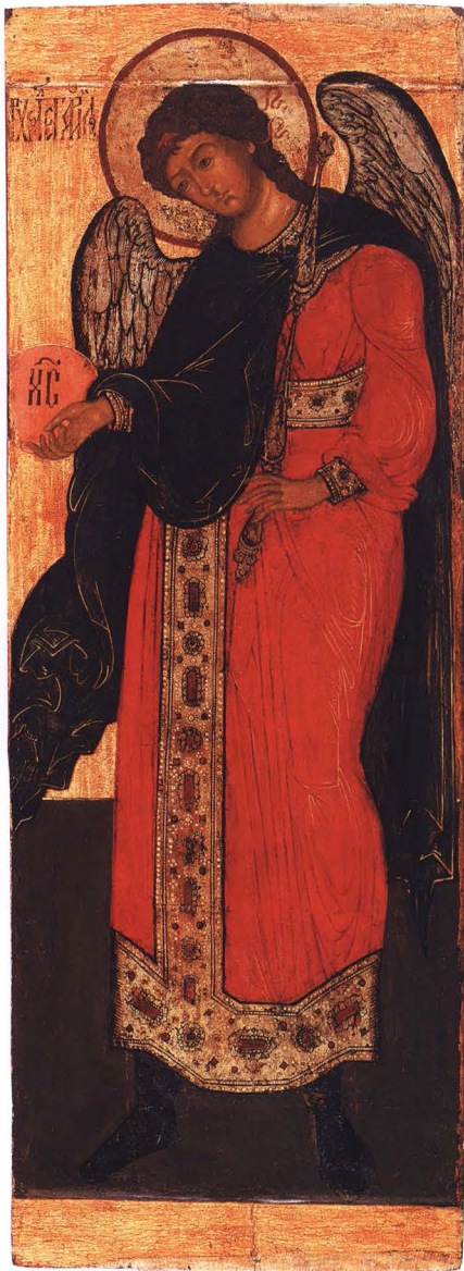
31. АРХАНГЕЛ ГАВРИИЛ Третья четверть XVII в. Поволжье. КАТ. 69