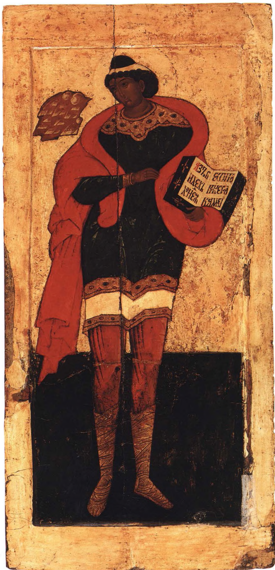
23. ПРОРОК ДАНИИЛ Начало XVII в. КАТ. 45