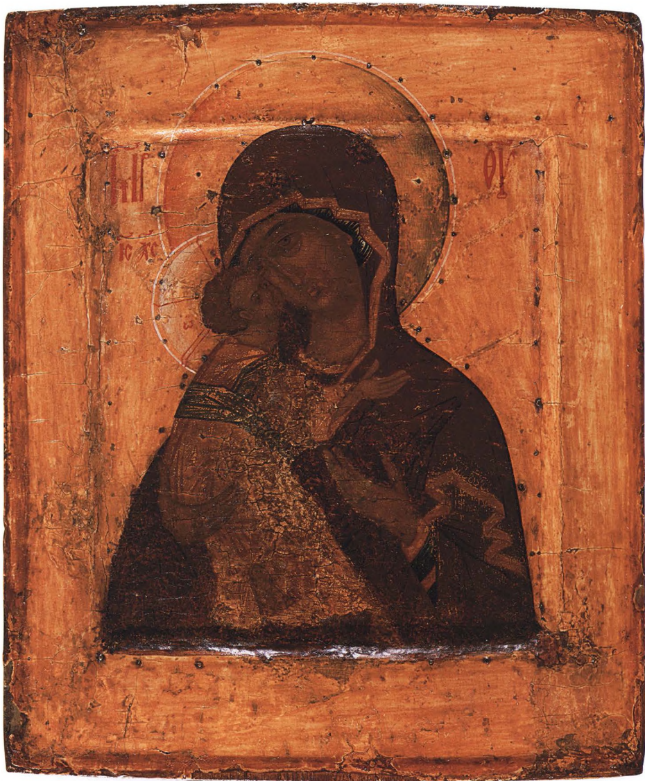
15. БОГОМАТЕРЬ ВЛАДИМИРСКАЯ Середина XVI в. Москва. КАТ. 19