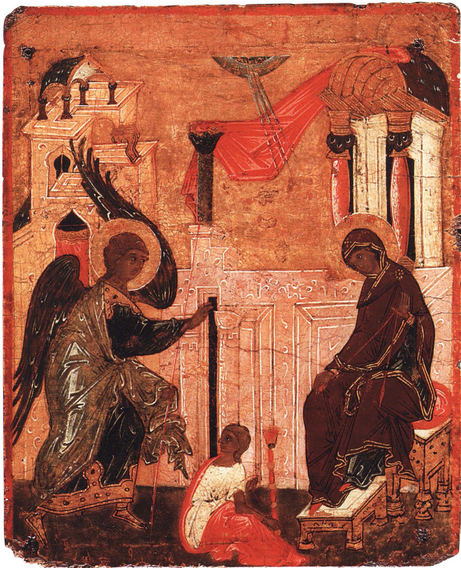
12. БЛАГОВЕЩЕНИЕ. ДВУХСТОРОННЯЯ ТАБЛЕТКА Середина XVI в. Ростов. КАТ. 15