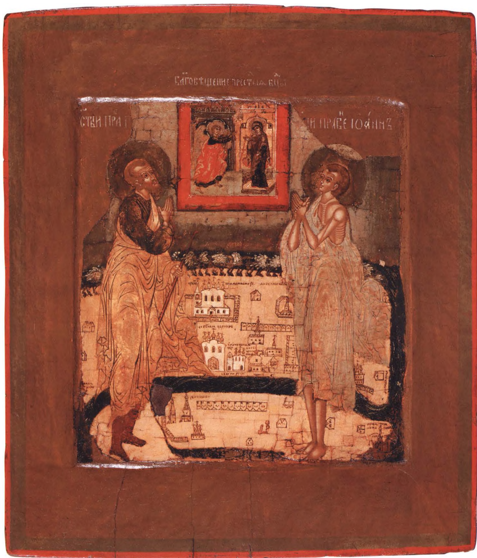
36. СВЯТЫЕ ПРОКОПИЙ И ИОАНН УСТЮЖСКИЕ Вторая половина XVII в. Великий Устюг. КАТ. 78