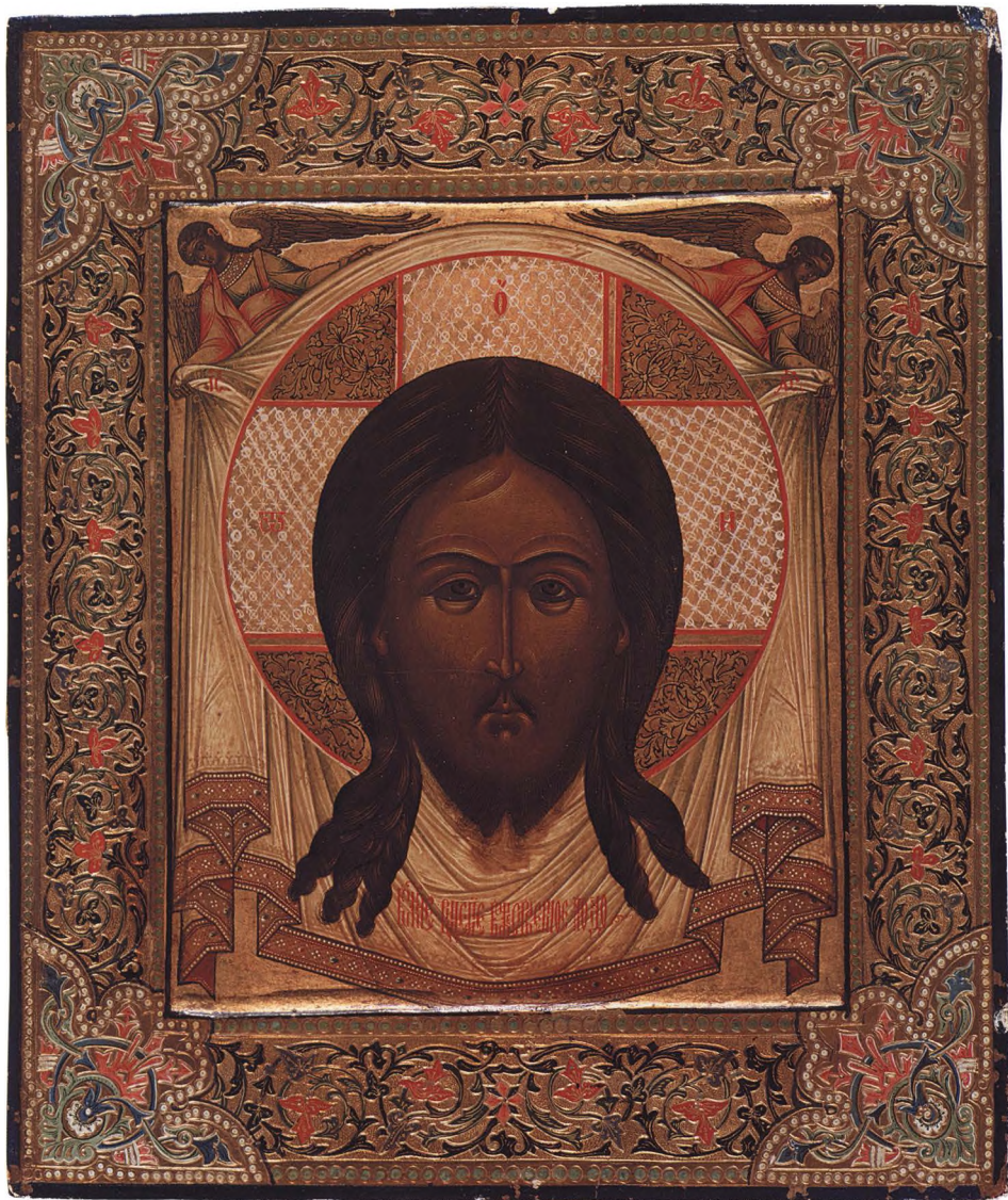
41. СПАС НЕРУКОТВОРНЫЙ Вторая половина XIX в., поновлена И.С. Чириковым в 1895 г. КАТ. 150