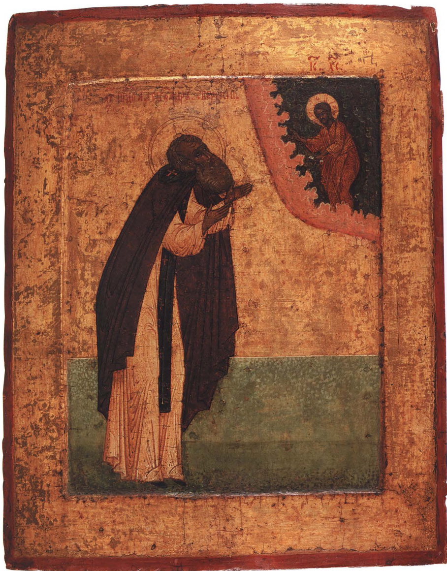
22. ПРЕПОДОБНЫЙ АЛЕКСАНДР СВИРСКИЙ Начало XVII в. КАТ. 44