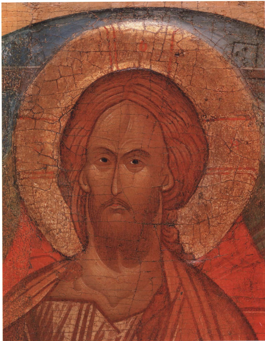
5. СПАС В СИЛАХ Деталь