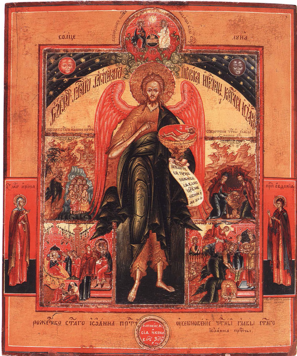
40. ИОАНН ПРЕДТЕЧА С КЛЕЙМАМИ ЖИТИЯ И СВЯТЫМИ НА ПОЛЯХ 1831 г. Симеон Иванов. Подмосковная старообрядческая мастерская. КАТ. 138