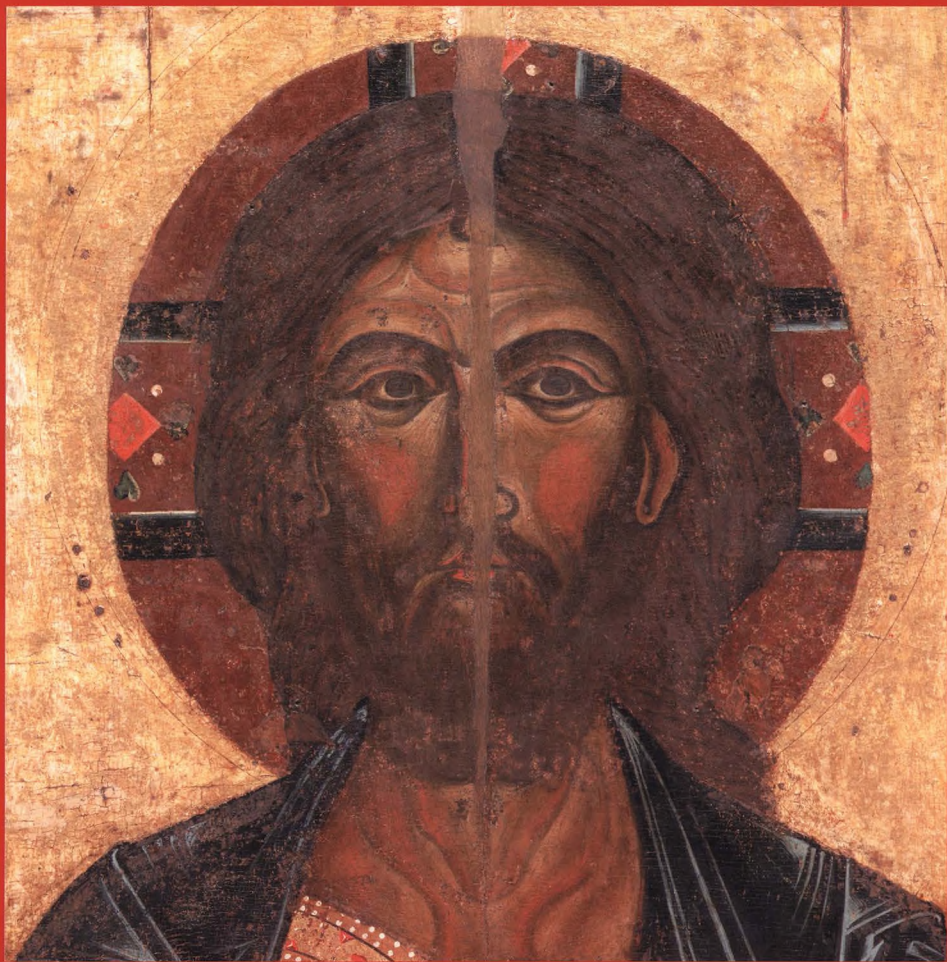
СПАС ВСЕДЕРЖИТЕЛЬ Первая половина XIII в. Ростов–Ярославль (?)