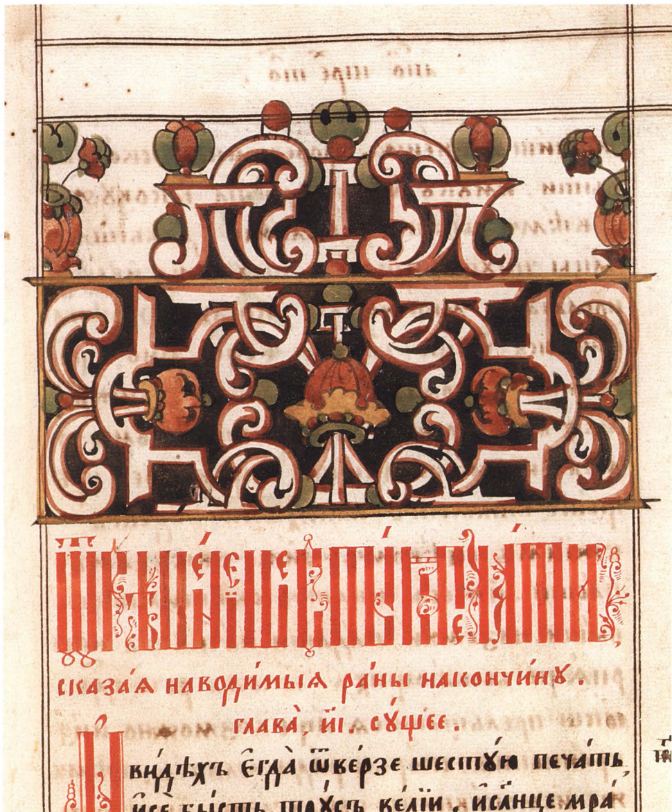
53. АПОКАЛИПСИС ТРЕХТОЛКОВЫЙ И СЛОВО О ВТОРОМ ПРИШЕСТВИИ ХРИСТОВОМ Деталь