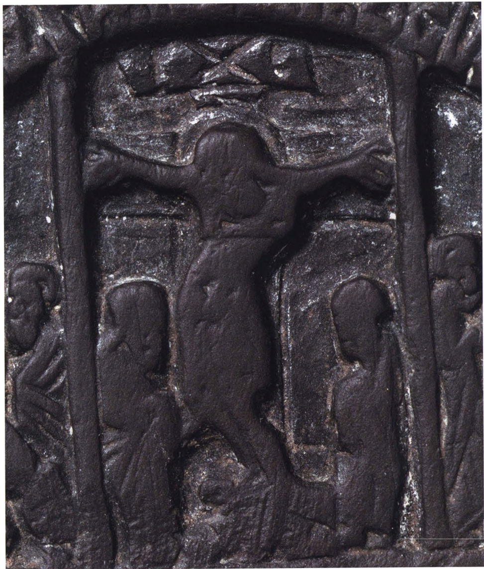
46. ИКОНА. ШЕСТЬ ПРАЗДНИКОВ Деталь