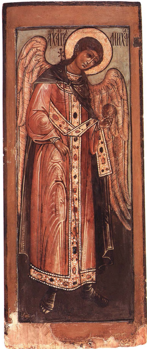
33. АРХАНГЕЛ МИХАИЛ Из деисуса. Вторая половина XVII в. КАТ. 75