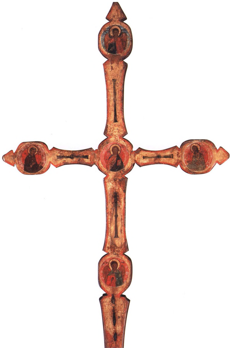
10. КРЕСТ ВЫНОСНОЙ (процессионный) Вторая четверть XVI в. КАТ. 12