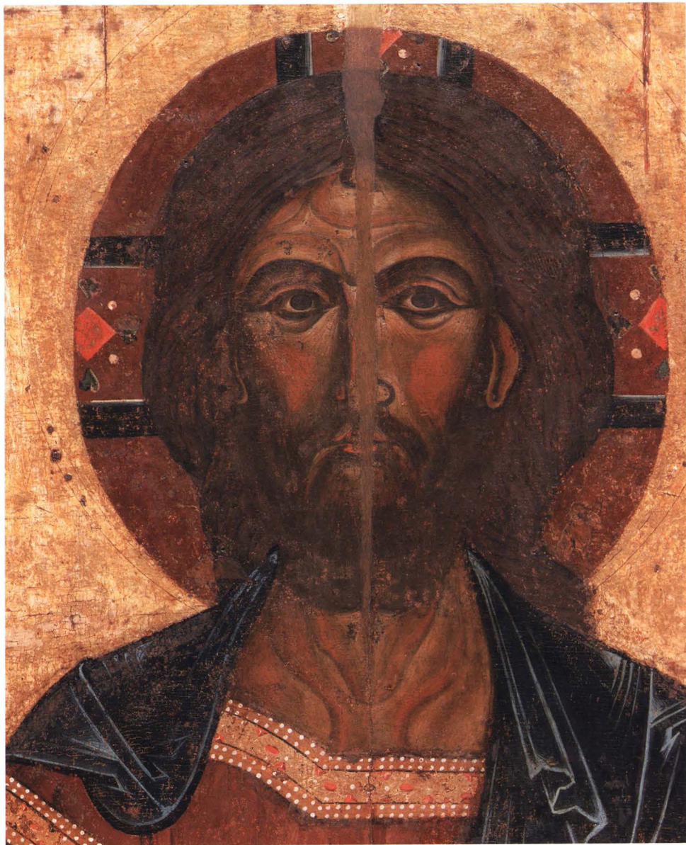
1. СПАС ВСЕДЕРЖИТЕЛЬ Деталь