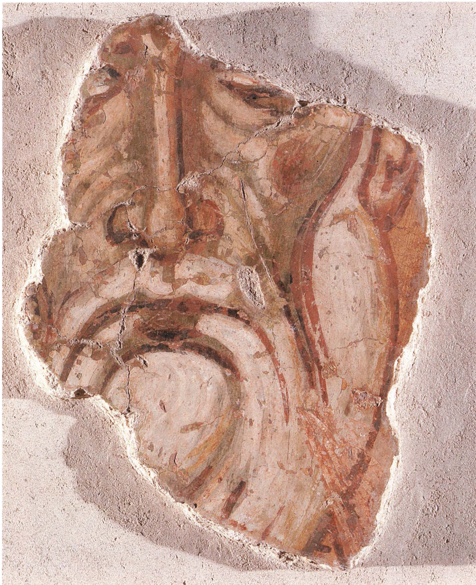
42. СВЯТИТЕЛЬ ИГНАТИЙ ГАНГРСКИЙ. Фрагмент 1199 г. Новгород. КАТ. 174