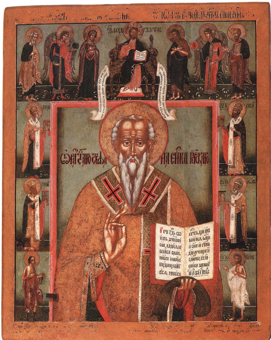
39. СВЯТИТЕЛЬ СТЕФАН ПЕРМСКИЙ С ДЕНСУСОМ И СВЯТЫМИ НА ПОЛЯХ 1717 г. КАТ. 101