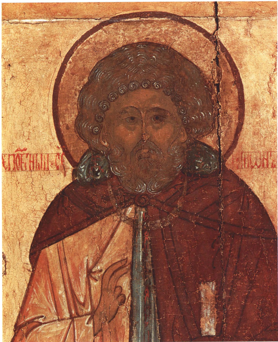
13. СТОЛПНИКИ СИМЕОН И ДАНИИЛ Деталь