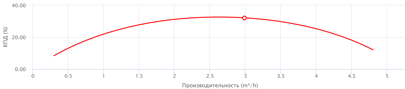
— КПД электронасоса