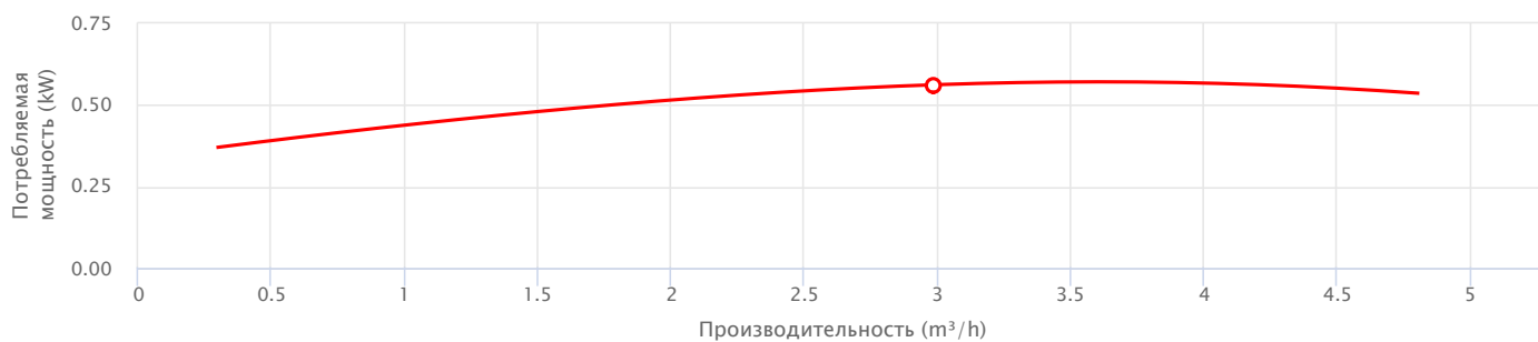
— Потребляемая мощность двигателя P1