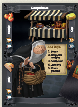
Торговый прилавок и Мешок