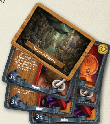
Карты чёрного рынка

Разложите карты так, чтобы они были видны всем игрокам. Карта с бóльшим значением кладётся поверх карты с меньшим значением.