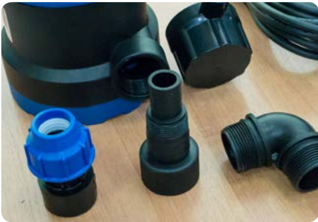
1. Собираем узел выброса воды