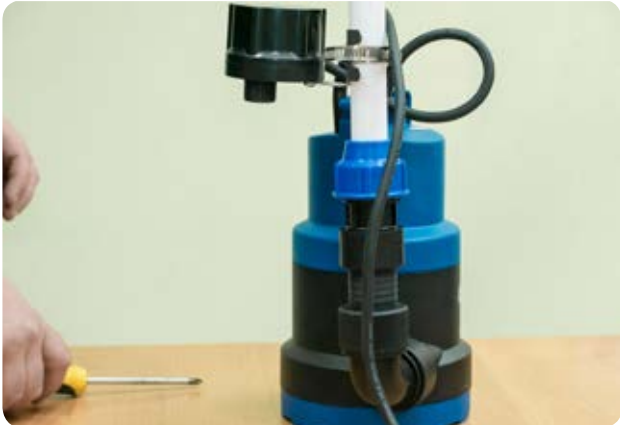
13. Монтируем ПП трубу через ПНД муфту на узел выброса воды