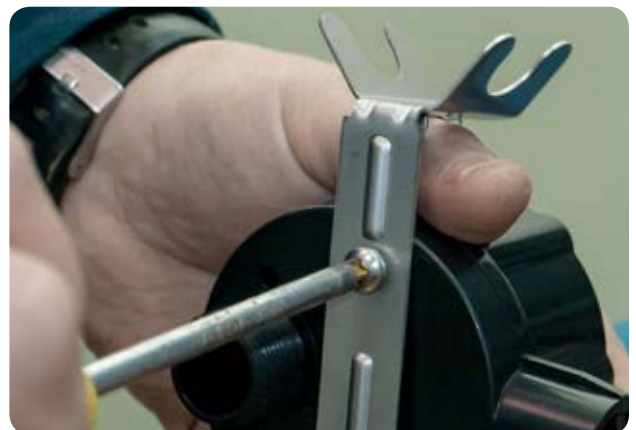
8. Ориентируем монтажную планку на корпусе выключателя в нужном положении