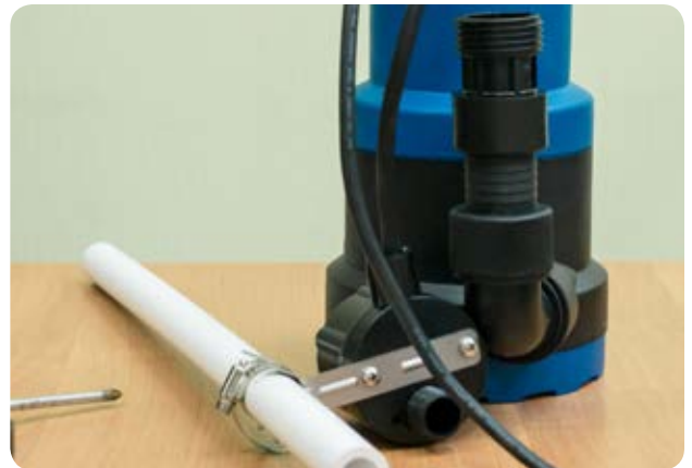
12. Хомут устанавливается не жёстко, для возможности последующей регулировки