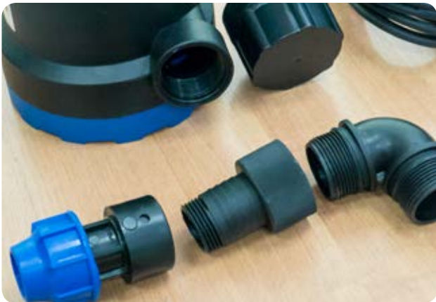
3. Порядок подготовки соединения