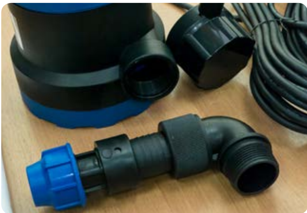
5. Прикручиваем ПНД муфту 32мм к ниппелю