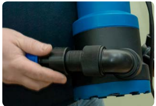
6. Прикручиваем собранный узел выброса к дренажному насосу