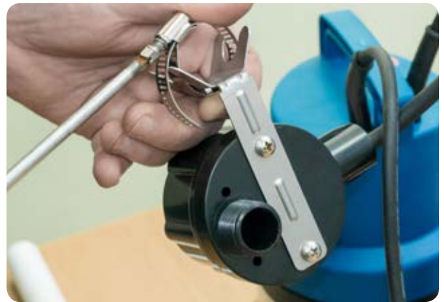
10. Регулируем хомут для крепления планки на напорную ПП трубу 25мм