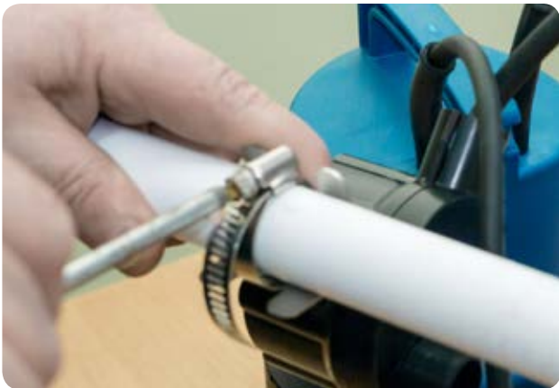
11. Крепим планку хомом к напорной ПП трубе