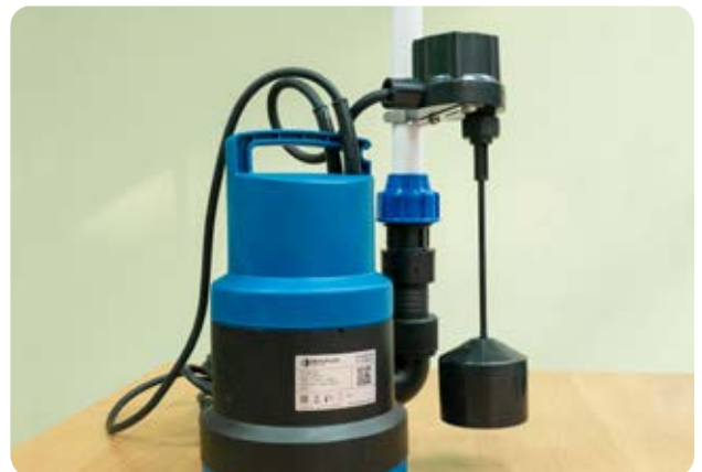
16. Ориентируем между корпусом насоса и узлом выброса воды