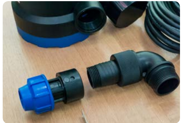
4. Накручиваем ниппель на соединительный отвод 90°