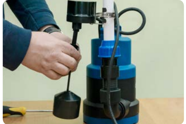
14. Прикручиваем штангу поплавка к вертикальному выключателю