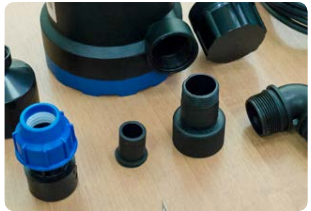
2. Отрезаем ёлку 25мм ниппеля до резьбы, для подсоединения ПНД муфты 32мм