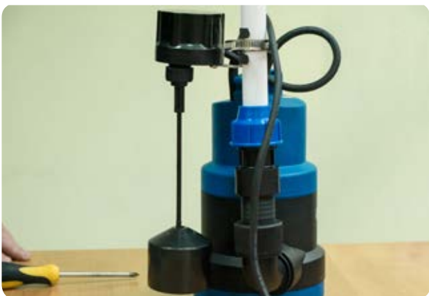
15. Регулируем высоту поплавкового выключателя