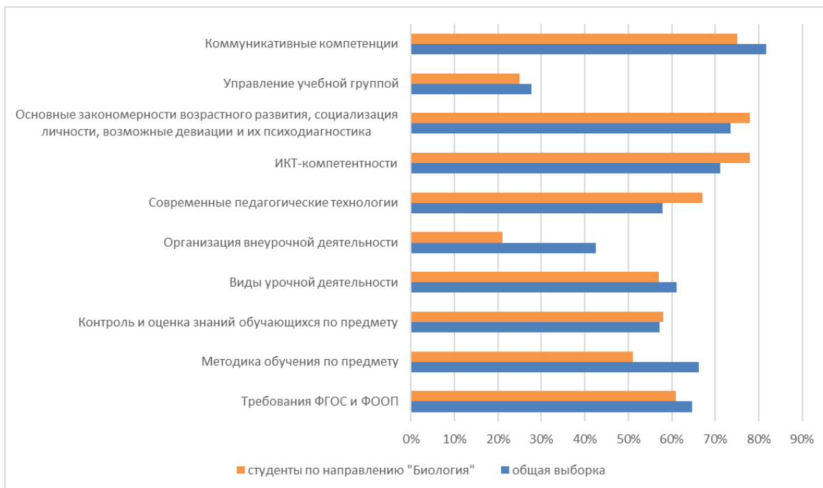
Рисунок 1. Результаты диагностики: суммарный показатель выполнения заданий по методическим и коммуникативным компетенциям по различным видам деятельности