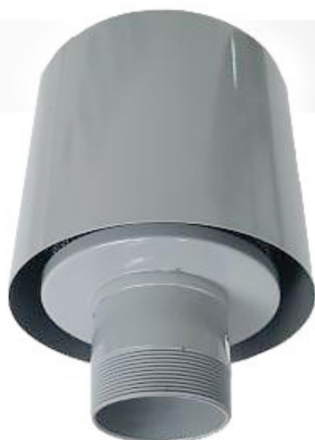
Фильтр для вихревой воздуходувки (компрессорный режим)

Позволяет защитить рабочее пространство воздуходувки от попадания твердых, взвешенных в нагнетаемом воздухе частиц.