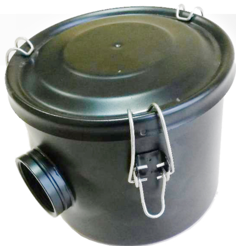
Фильтр для вихревой воздуходувки (вакуумный режим)

Позволяет защитить рабочее пространство воздуходувки от попадания твердых, взвешенных в откачиваемом воздухе частиц.