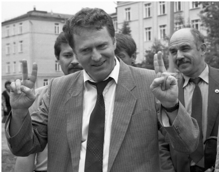
Жириновский Владимир Вольфович

Владимир Вольфович, Ты – Мы, России-матушки – Эпоха! В Тебе, Мы видели Себя, Прямую Честность, без подвоха.