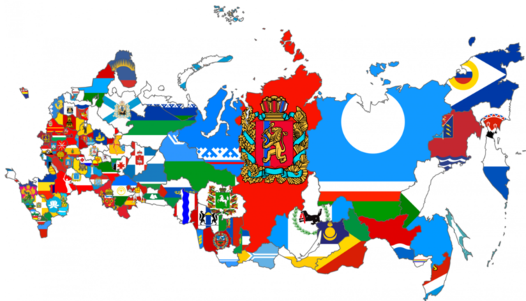
Карта субъектов Российской Федерации с нанесёнными на них флагами