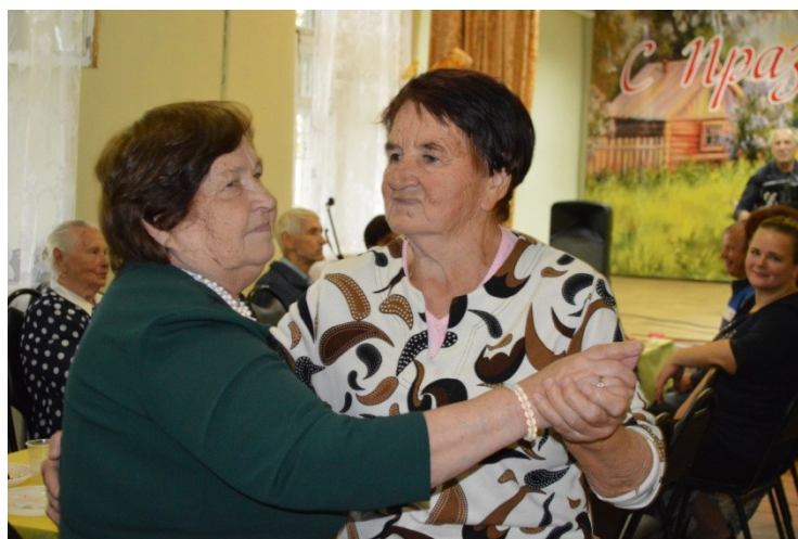
Развлекательная программа "Вместе встретим Новый год" для ветеранов очень весело. Наши сельчанки, как всегда, показали свои незаурядные творческие способности, умение веселиться и радоваться жизни.