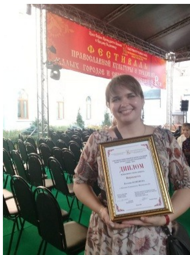
Коллектив «Ассорти» - Лауреат Всероссийского конкурса «Грани искусства».