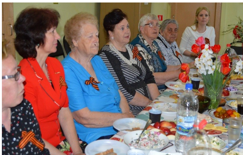
Праздничная программа "Посидим по- хорошему", посвященная Дню пожилого человека, прошла 1 октября в Большеалексеевском ДК (30 чел.).