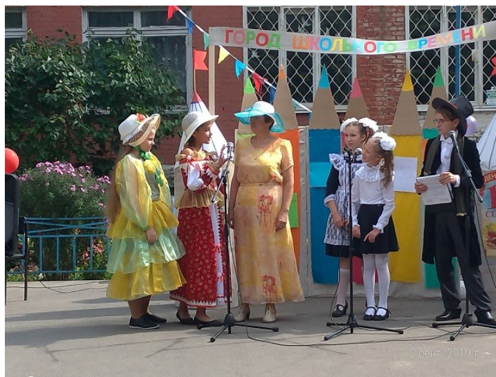
Концерт с элементами театрализации «Рождественская сказка» проведен 7 января. Проведен театрализованный концерт на День села.