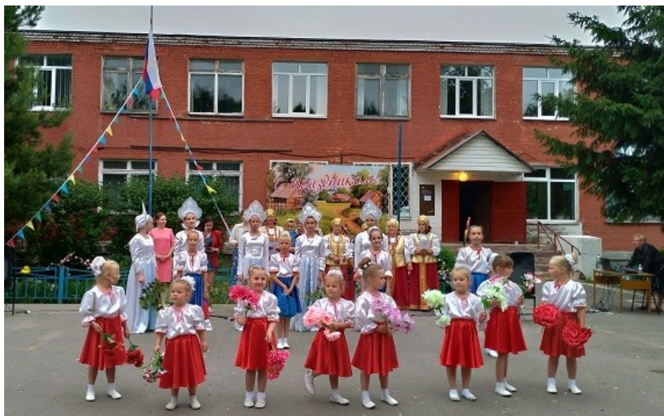
14) Концерт на День села Большое Алексеевское - «Моё любимое село – частичка Подмосковья» - 30 июня.