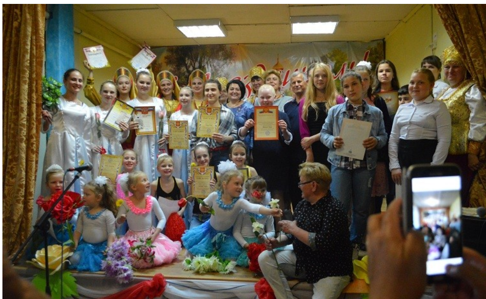
11) Концертная программа «Русскому слову посвящается» -24 мая.