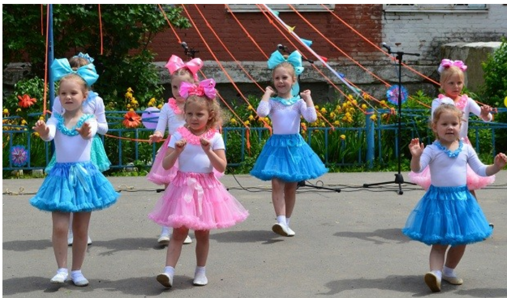
13) Праздничная концертная программа «Я люблю тебя, Россия» - 12 июня