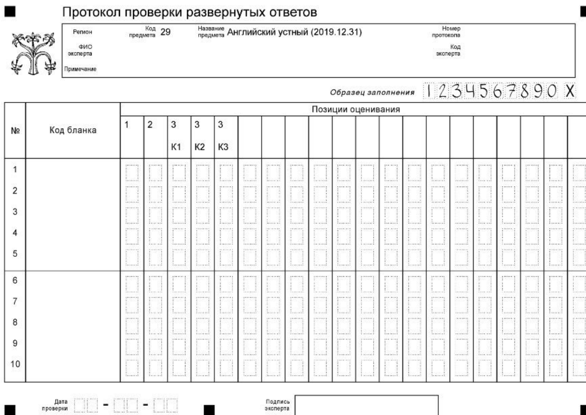
Рисунок 1. Вариант формата бланка протокола проверки развернутых ответов

Внимание! При выставлении баллов за выполнение задания в Протокол проверки развернутых ответов следует иметь в виду, что если ответ отсутствует (нет никаких записей, свидетельствующих о том, что экзаменуемый приступал к выполнению задания), то в протокол проставляется «X», а не «0».