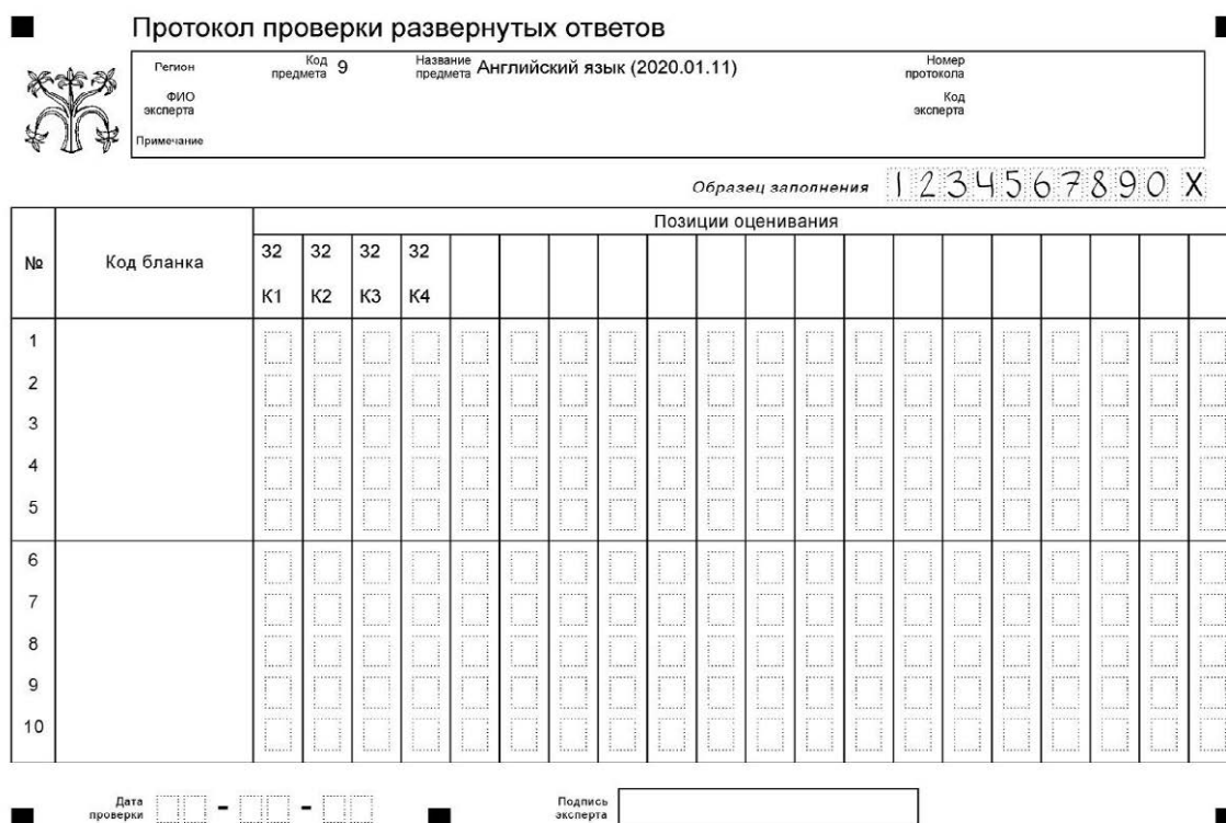
Рисунок 1. Вариант формата бланка протокола проверки развернутых ответов

Результаты оценивания заданий фиксируются в протоколе проверки развернутых ответов 4 .