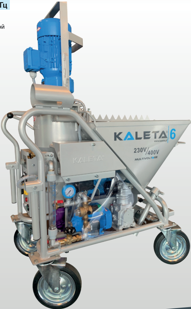
Тип. КАЛЕТА – 6 230 / 400В MULTIVOLTAGE