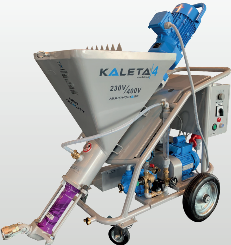
Тип. КАЛЕТА – 4 230 / 400В MULTIVOLTAGE