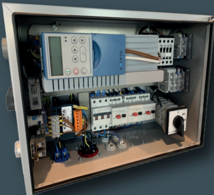
Тип. КАЛЕТА – 4 S 230 / 400В MULTIVOLTAGE