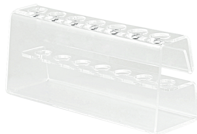
ПСМВ1 для 11 кистей ширина 17,5 см глубина 5 см