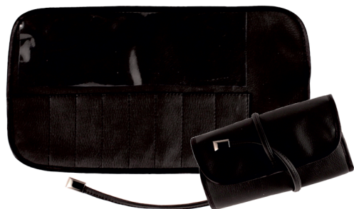
Ф82М 29,5x16,5 см