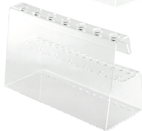
ПСМВЗК для 21 кисти ширина 24 см глубина 9,5 см