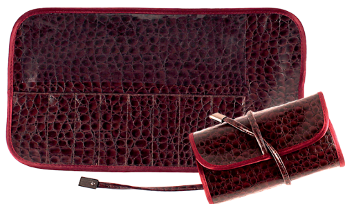
Ф88М 29,5x16,5 см