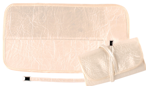
Ф85М 29,5x16,5 см