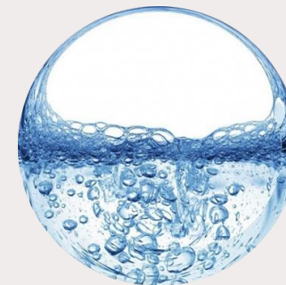
ГИАЛУРОНОВАЯ КИСЛОТА –

восстанавливает волоски брови, делая их более здоровыми и упругими