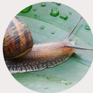
ЭКСТРАКТ МУЦИНА УЛИТКИ

стимулируют обновление клеток кожи, делая ее более гладкой