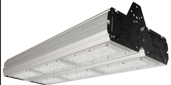
Street 300 на подвесах

Дополнительная информация по тел.: (3842) 455-911