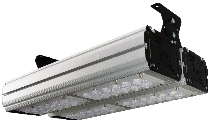
Street 200 на скобе