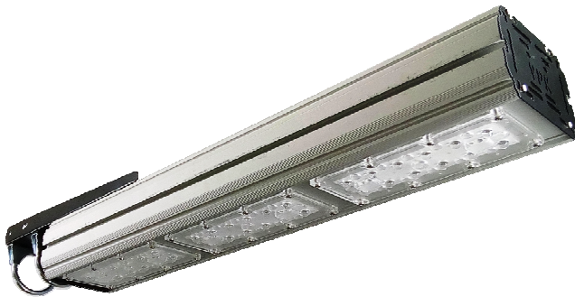
Street 150 на трубу