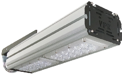
Street 100 на трубу