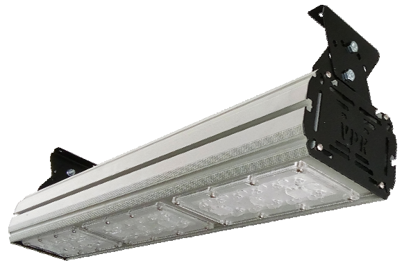
Street 150 скобе