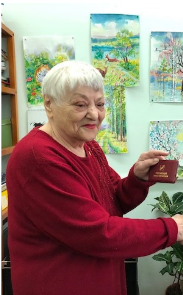
Получение удостоверения члена Российского союза писателей